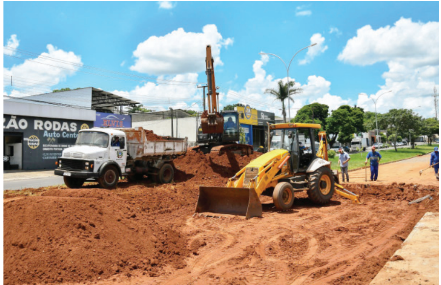
A CAPA asfáltica ainda será colocada mas o tráfego de carros e caminhões foi liberado para ajudar na compactação