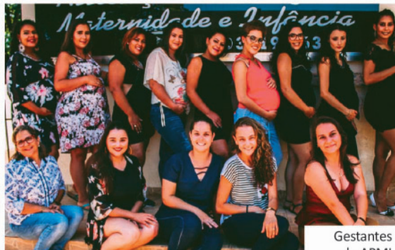
Gestantes do APMI que foram contempladas pelo projeto