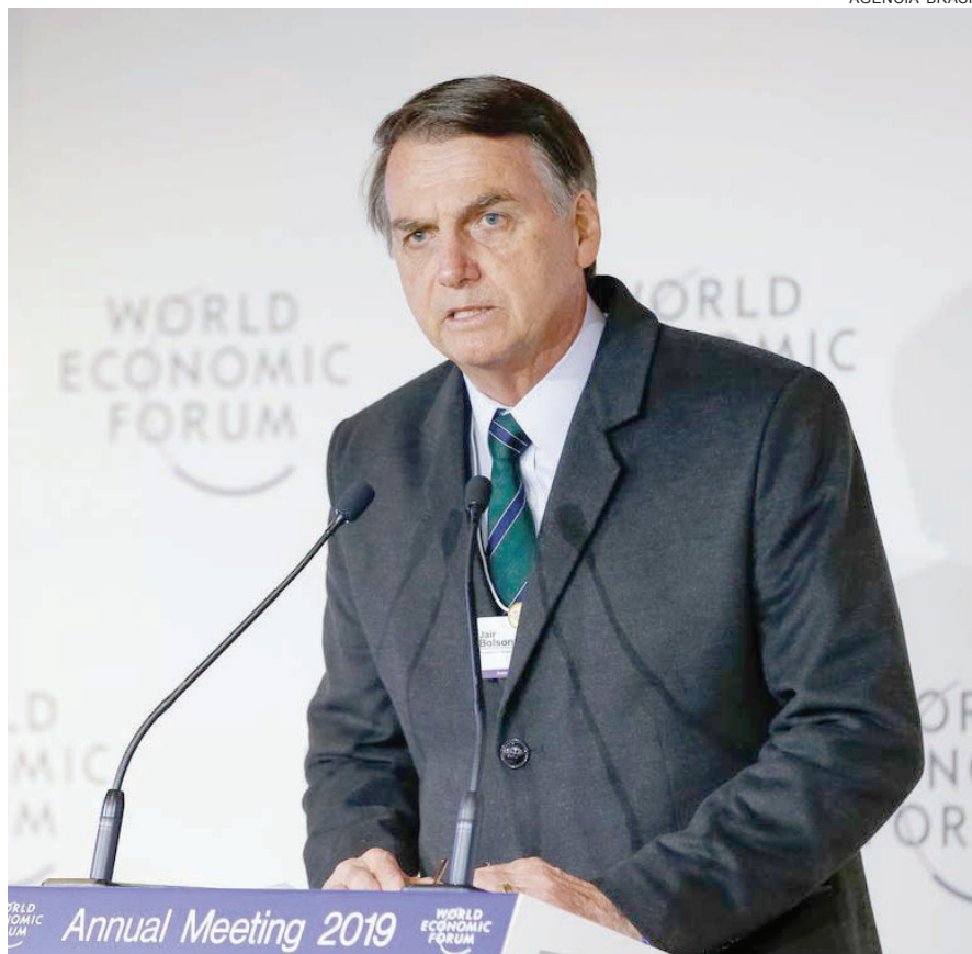
JAIR Bolsonaro encerrou ontem sua participação em Davos

“Estamos de braços abertos e queremos fazer negócios. O que eles pedem? O Brasil é um dos países mais difíceis de se fazer negócios, eles querem que o Brasil seja desburocratizado, diminua sua carga tributária e elimine barreiras”, destacou. “Acredito que, fazendo o dever de casa, o Brasil sai fortalecido.”