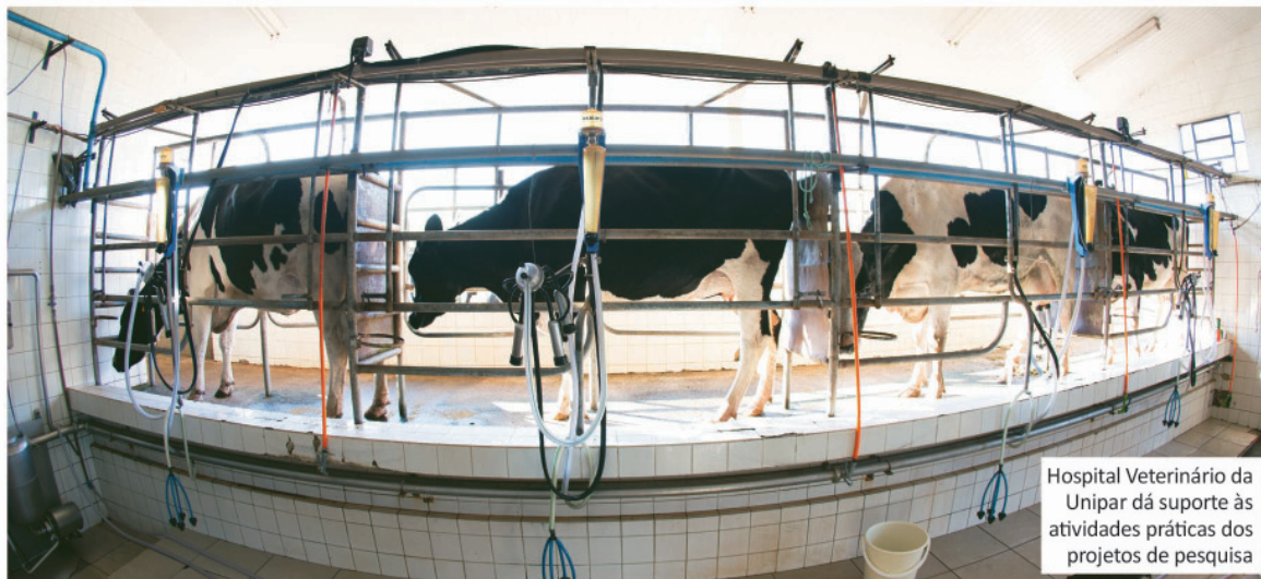
Hospital Veterinário da Unipar dá suporte às atividades práticas dos projetos de pesquisa

Na modalidade stricto sensu , a Unipar oferece ainda outras quatro opções de cursos. Os profissionais que querem alavancar a carreira e se destacar no mercado de trabalho podem optar pelos mestrados em Direito Processual e Cidadania e em Plantas Medicinais e Fitoterápicos na Atenção Básica; e pelo mestrado e doutorado em Biotecnologia Aplicada à Agricultura.