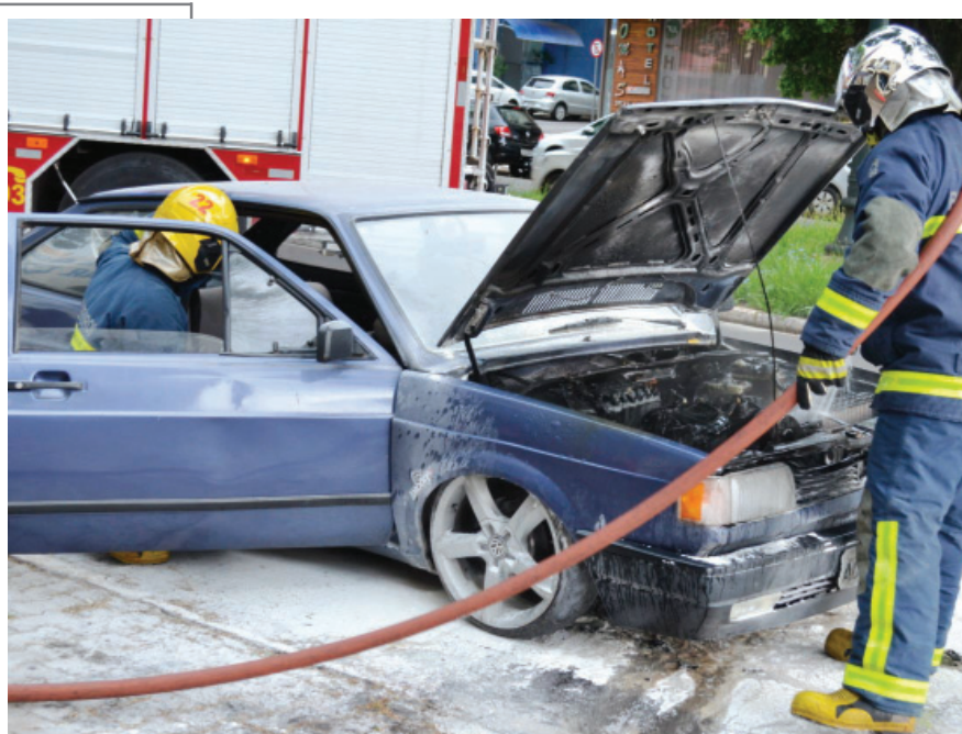
Bombeiros combateram um incêndio em veículo na manhã de ontem (24) na avenida Londrina. Um Gol de Maringá adquirido recentemente por um jovem de 22 anos começou a se incendiar. Quando notou que pegava fogo, o rapaz parou o carro e saiu correndo. Populares usaram extintores para controlar as chamas até a chegada dos bombeiros. Não houve feridos. A causa pode ter sido uma pane elétrica.

A Prefeitura vai fiscalizar e notificar prédios e condomínios que não atenderem as recomendações dentro do prazo estabelecido. “Nos colocamos à disposição, na Diretoria de Meio Ambiente, para orientar em caso de dúvidas e também para fornecer assistência técnica caso haja interesse em compostagem, por exemplo, para aproveitar de forma coerente os resíduos orgânicos”, disse.