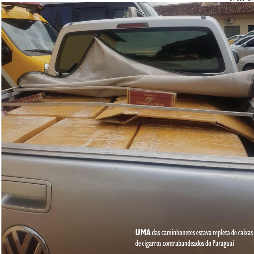
UMA das caminhonetes estava repleta de caixas de cigarros contrabandeados do Paraguai

Um terceiro veículo, Santa Fé, despertou suspeitas. Um homem se apresentou como proprietário e acompanhou a busca que foi realizada com apoio da equipe Canil do 25 Batalhão da Polícia Militar (BPM).