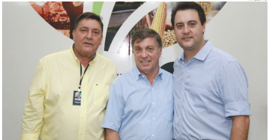
GOVERNADOR visitou Umuarama no lançamento da Expo 2019