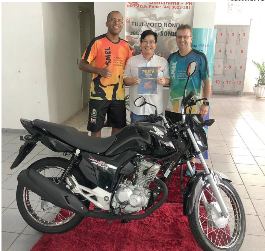
A EQUIPE campeã vai levar uma moto Honda 160 cilindradas 0 km

A Federação Paranaense de Futsal definiu a data do arbitral Série Ouro 2019. A reunião acontecerá no dia 23 de fevereiro em Foz do Iguaçu, com as equipes que participarão da competição. O campeonato que está marcado para 23 de março, contará com 14 equipes: Umuarama Futsal, Foz Futsal, Marreco, Pato Futsal, Anymoré/Matelândia, Copagril/ Marechal Rondon, Campo Mourão, Cascavel, São José dos Pinhais, Palmas, São Lucas/Paranavaí, Toledo, Amperé e Dois Vizinhos.