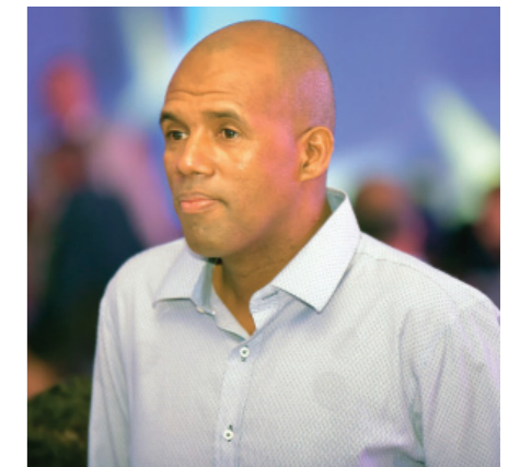
Vereador Noel Bernardino / Noel do Pão