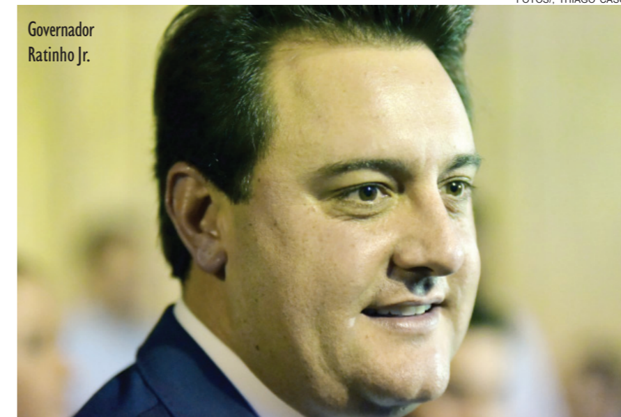
Governador Ratinho Jr.