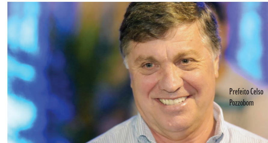
Prefeito Celso Pozzobom