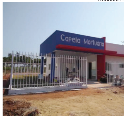
CAPELA mortuária do distrito Lovat será inaugurada amanhã (10)