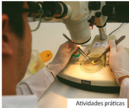
Atividades práticas e de pesquisa: para todos esses cursos, a Unipar oferece mais de vinte laboratórios, com aparelhagem moderna e potente