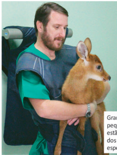
Grandes animais, pequenos e silvestres estão no foco dos projetos de especialização da Unipar