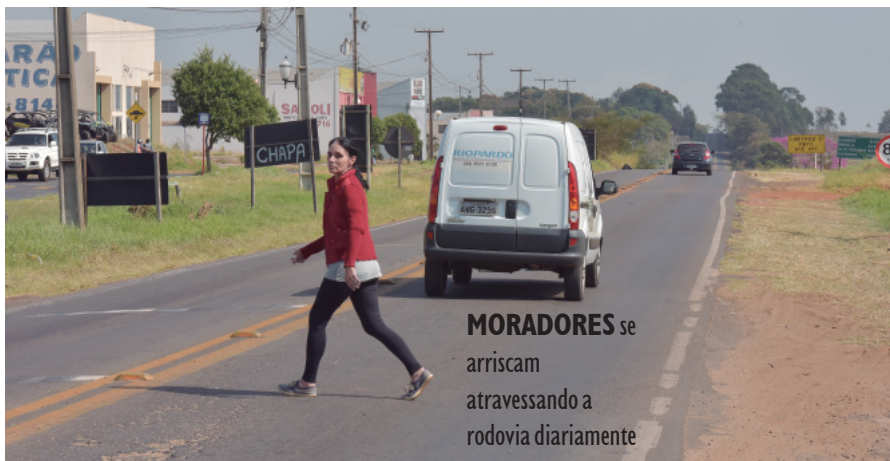
MORADORES se arriscam atravessando a rodovia diariamente