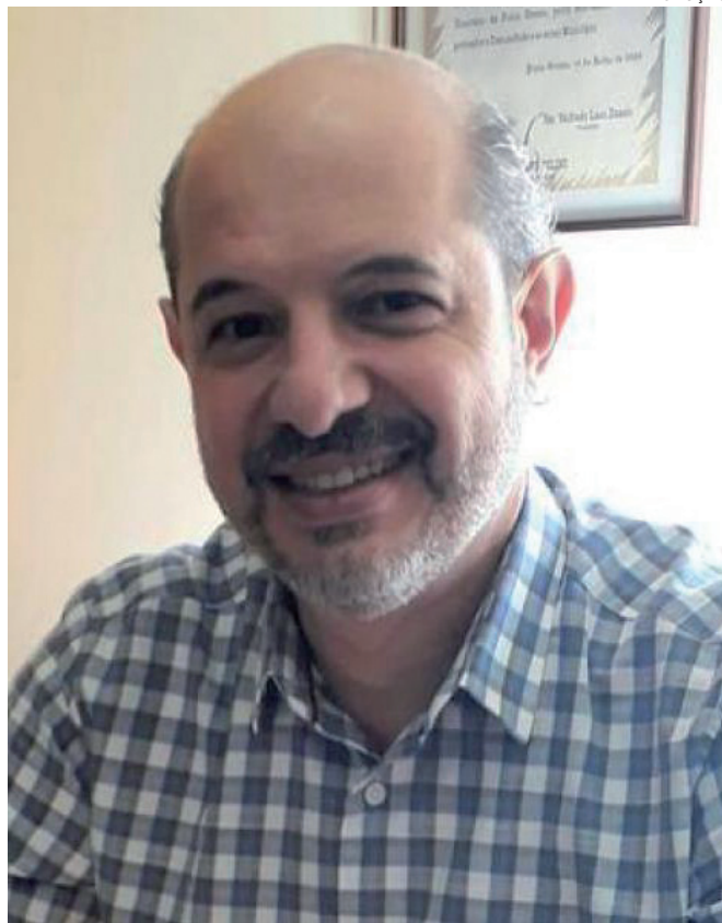
SECRETÁRIO Estadual do Esporte e do Turismo, João Carlos Barbiero

convenio os Municípios de Tapira, Douradina e Alto Piquiri e poderá ainda atender mais alguns municípios da região conforme o protocolo de adesão. O Secretário e sua equipe de gabinete também estarão explanando sobre o andamento das Políticas Públicas para o setor que o Governo do Estado e a SEET vem desenvolvendo, seus resultados e aplicabilidade até o momento e as tendências futuras.