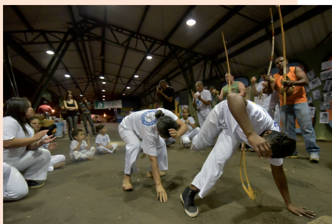
ASSOCIAÇÃO de Capoeira Afoxé