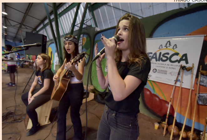
BANDA As Walkírias