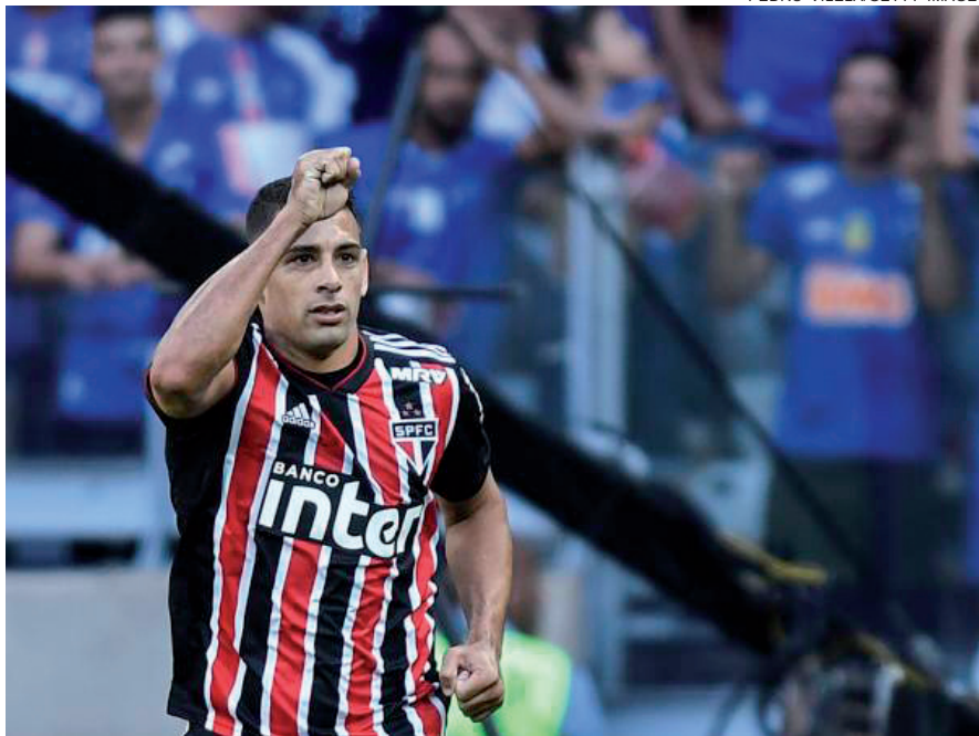
SÃO PAULO vence fora de casa e se matém na segunda colocação

Mesmo jogando no Mineirão, o São Paulo mostrou força, derrotou o Cruzeiro por 2 a 0 e segue na cola do líder Flamengo. Diego Souza e Everton fizeram os gols, e Barcos ainda perdeu um pênalti para os donos da casa, quando a partida estava 1 a 0. Dois pontos separam os dois melhores times do Brasileiro: 34 a 32. "Foi um jogo difícil, mas conseguimos vencer com garra e personalidade. Conseguimos marcar bem, e não é qualquer equipe que consegue fazer isso no Mineirão," festejou Diego Souza, que é, ao lado de Nenê, o artilheiro na temporada, com 10 gols. Com a nova vitória, o time de Diego Aguirre se consolida como o melhor visitante do Brasileiro: são 15 pontos em nove partidas. (Placar)