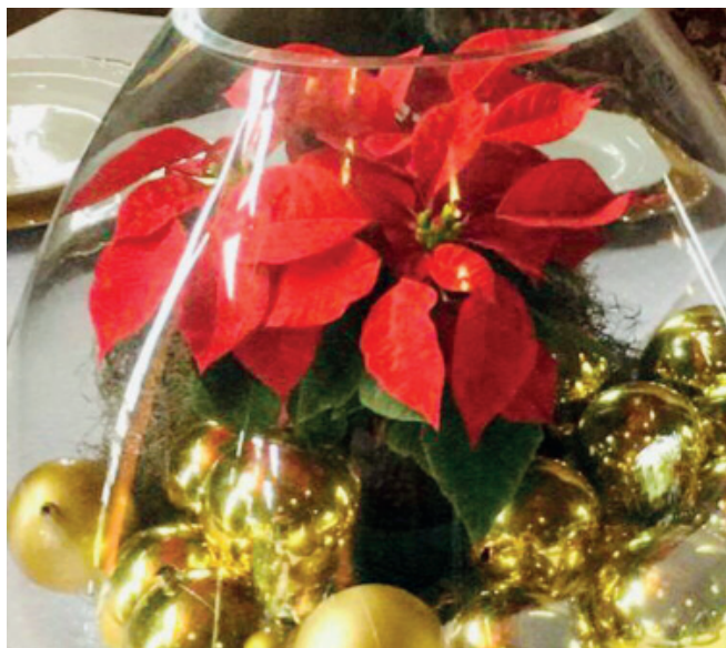
NOS tons do Natal ...

A noite de confraternização da confraria 'Parceiros do Vinho' aconteceu na última sexta-feira (30) com ares de Natal e com decor nos tons do Papai Noel, do vinho e da alegria dos confrades presentes. Música boa, amigos e os vinhos Caballo Loco e Pulenta deram o tom da noite. Os selfies e os cliques mostram uma pouco da festa, no Rancho do Cavalo.