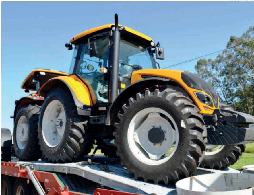
TRATORES recuperados estavam no pátio de um posto de combustíveis às margens da rodovia PR-323

Ele foi vendado e colocado na cabine do caminhão até que acontecesse o desengate. Em seguida, foi levado refém, colocado posteriormente no porta malas de um carro desconhecido e levado até uma casa. A vítima foi libertada somente por volta das 20h de domingo (2) em uma estrada rural. Somente depois disso é que conseguiu comunicar a polícia. O caminhão está sendo procurado pelos policiais.