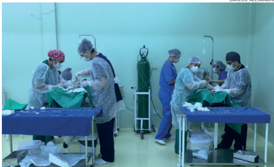
PROGRAMA de castração de animais de rua realizou 18 cirurgias em cães capturados em Altônia

Os animais foram resgatados e transportados pela Vigilância Sanitária até o Hospital Veterinário da Unipar em Umuarama. Somente lá é que foram submetidos às cirurgias, realizadas por acadêmicos da graduação, do mestrado e doutora-