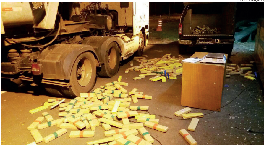
DROGA apreendida estava escondida no caminhão que era conduzido por umuaramense

O motorista revelou aos patrulheiros que havia sido contratado para levar o cavalo-trator de Umuarama para Aral Moreira/MS, onde se atre-