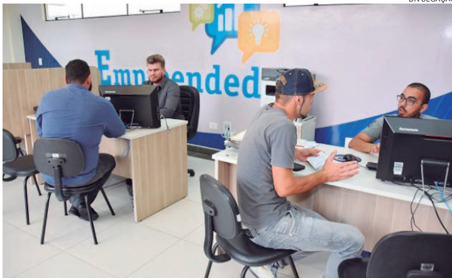
CURSO voltado à área de finanças é uma parceria com o Sebrae

Ele lembra que o brasileiro é empreendedor por natureza, sabe definir e executar muito bem o seu comércio, indústria ou prestadora de serviços, “porém, muitas vezes falta apenas atenção aos detalhes para que o empreendimento alcan-