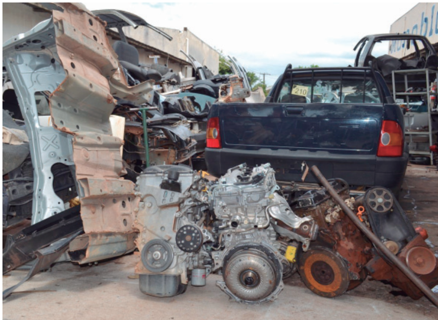
MOTORES de veículos furtados foram apreendidos e outros estavam com numeração suprimida