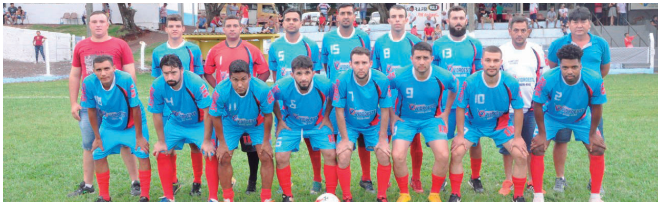
VIDROESTE de Umuarama, está entre as cinco equipes classificadas para a próxima fase da Taça Pegoraro

No último final de semana aconteceu a penúltima rodada pela Taça Pegoraro de Futebol Suíço Regional do Jardim Jussara e Panorama em Assis Chateaubriand.