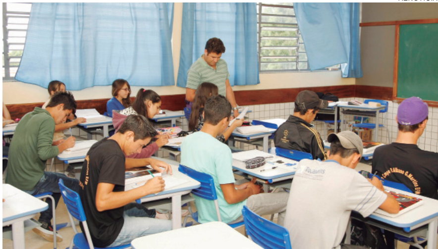
CERCA de 600 mil alunos farão as provas hoje

Os gestores escolares vão corrigir em tempo recorde por meio de um aplicativo de celular - o Mira Aula. Para a correção, basta capturar a imagem do cartão-resposta de cada aluno com o aplicativo, sem necessidade de acesso à internet, e os resultados das provas são registrados. Esse recurso possibilitará que a correção das provas de cada turma seja concluída em cerca de dez minutos.