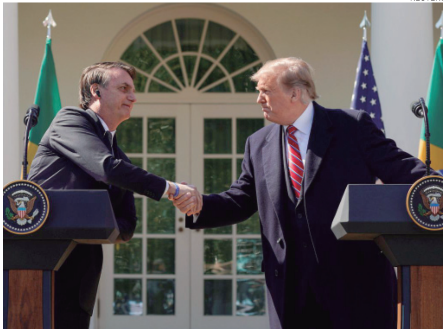
TRUMP e Bolsonaro se reuniram na Casa Branca: reunião “excelente”, disse Trump

O presidente dos Estados Unidos, Donald Trump, afirmou que o Brasil será designado principal aliado dos Estados Unidos fora da Otan (Organização do Tratado do Atlântico Norte). Ainda deixou aberta a possibilidade de o Brasil integrar a Otan, que é uma organização militar formada por países da Europa e da América do Norte, com origem na oposição ao socialismo liderado, na época, pela União Soviética, hoje extinta.