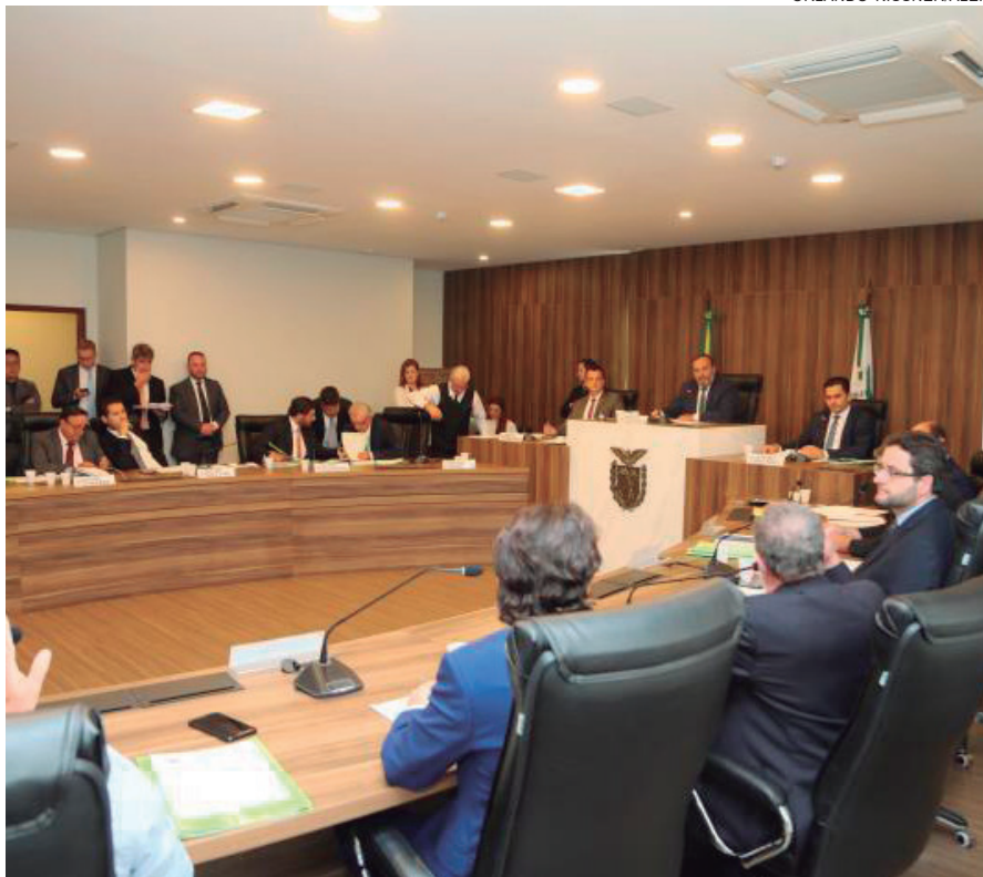
A CCJ em reunião que discute o fim da aposentadoria para ex-governadores

A pauta da CCJ inclui também o projeto de lei complementar nº 1/2019, de autoria do Poder Executivo, alterando dispositivo da Lei Complementar nº 131/2010, que dispõe sobre a reestruturação da carreira do agente fiscal da Coordenação da Receita do Estado (CRE). A matéria tramita em regime de urgência.