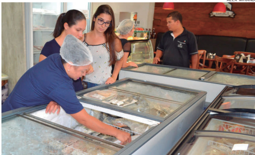
PROCURA e consumo aumentaram cerca de 50% no primeiro dia da Quaresma