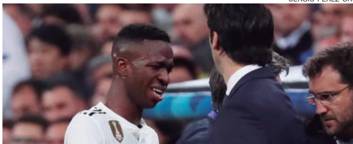
VINICIUS Júnior deixa campo chorando após se lesionar em Real Madrid x Ajax

O brasileiro se lesionou aos 30 minutos do primeiro tempo contra