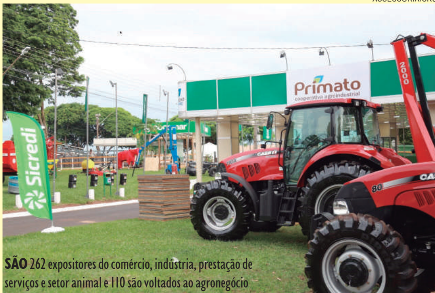
SÃO 262 expositores do comércio, indústria, prestação de serviços e setor animal e 110 são voltados ao agronegócio

São 262 expositores do comércio, indústria, prestação de serviços