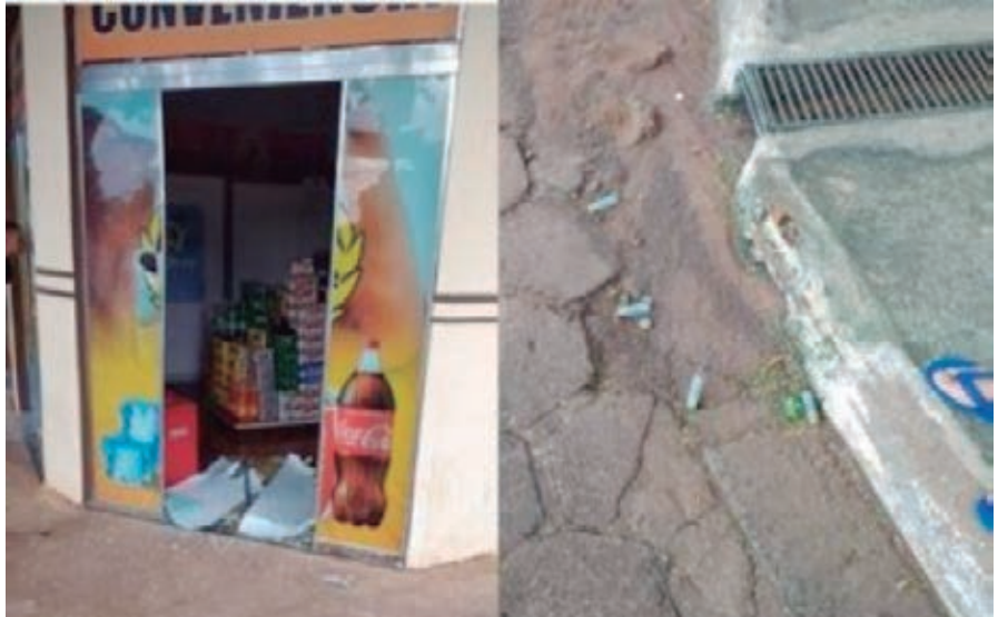
FACHADA da loja de conveniência ficou marcada pelos tiros e cartuchos deflagrados foram deixados nas proximidades

Ao serem informados que o dinheiro já estava no banco, os criminosos se apossaram de cerca de R$ 1.000 em espécie e do carro. Testemunhas relataram que os bandidos também usaram um Gol