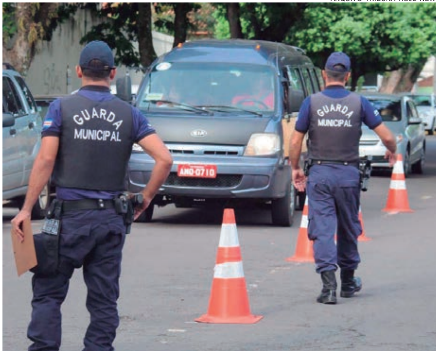
QUASE 700 ocorrências nos meses de janeiro e fevereiro foram atendidas pela GM em Umuarama