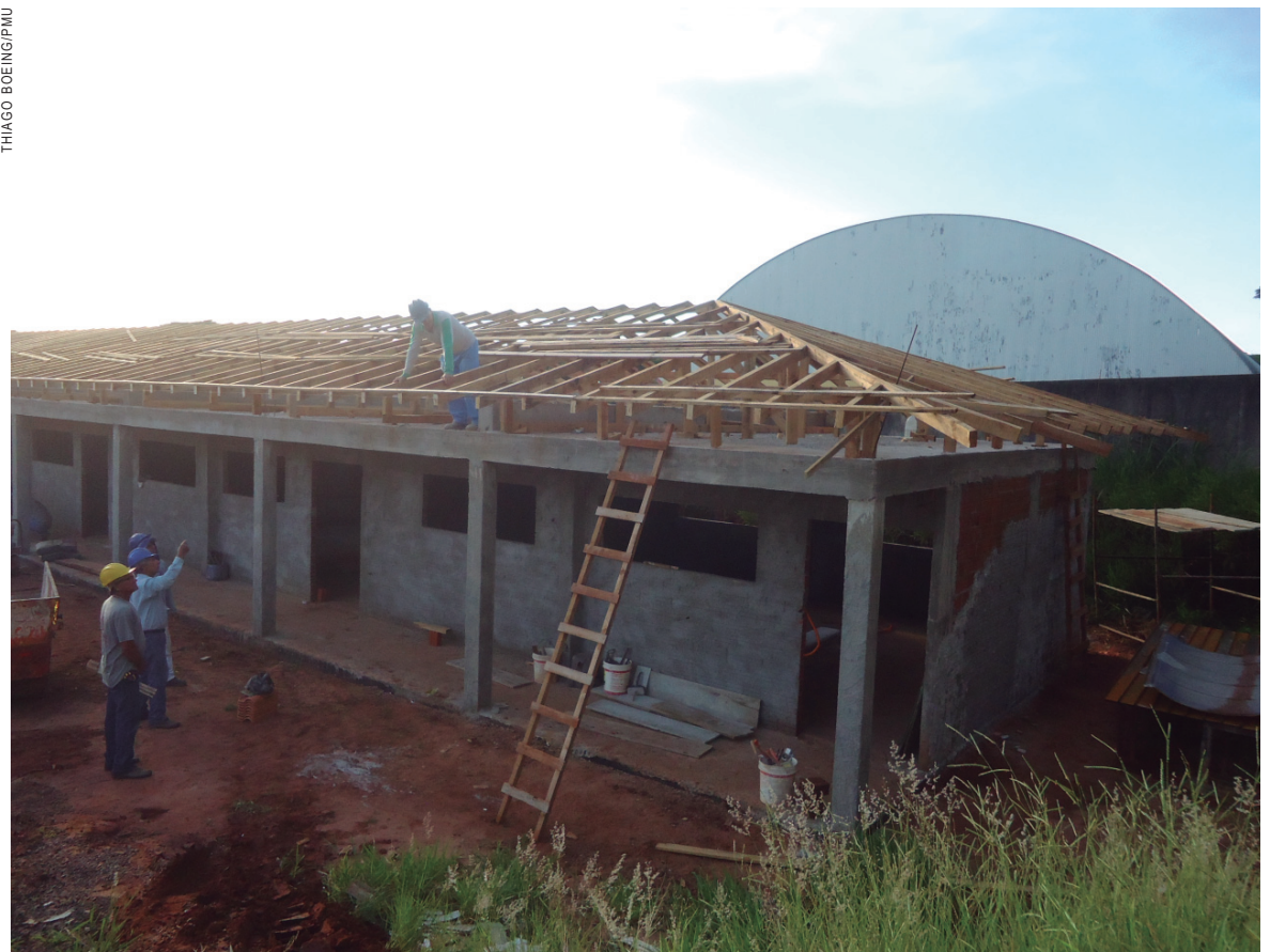
Ampliação da Escola São Francisco de Assis

A unidade terá quadra coberta, vestiários, pátio coberto, amplo refeitório, cozinha, despensa, área de serviço, laboratório, sala de informática, biblioteca, auditório