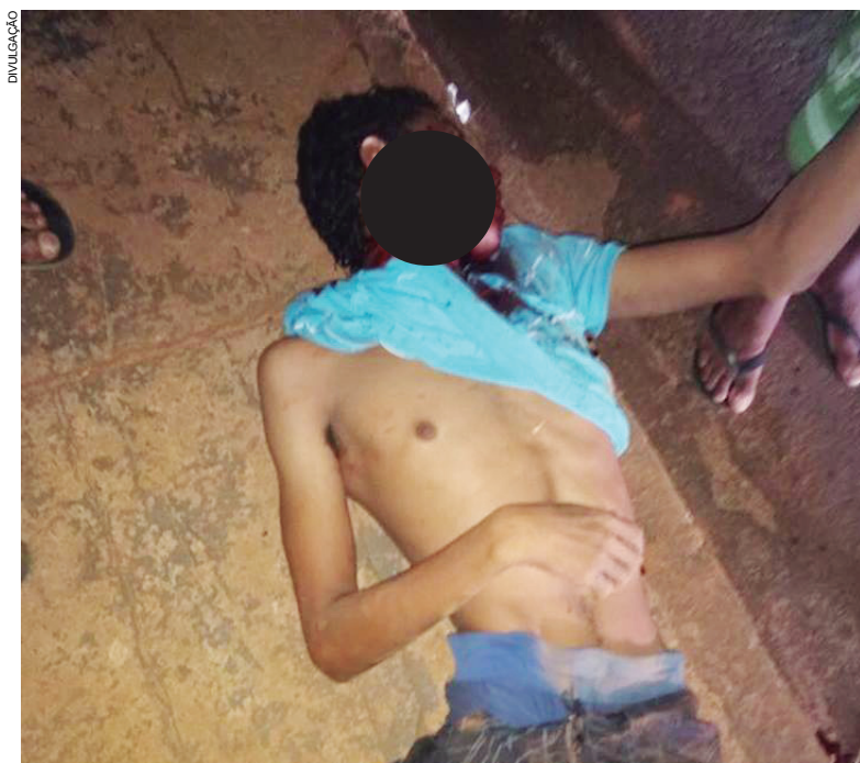
Homem morto numa emboscada em bairro de Mariluz. Colega que seria o alvo dos criminosos estava com filha no colo