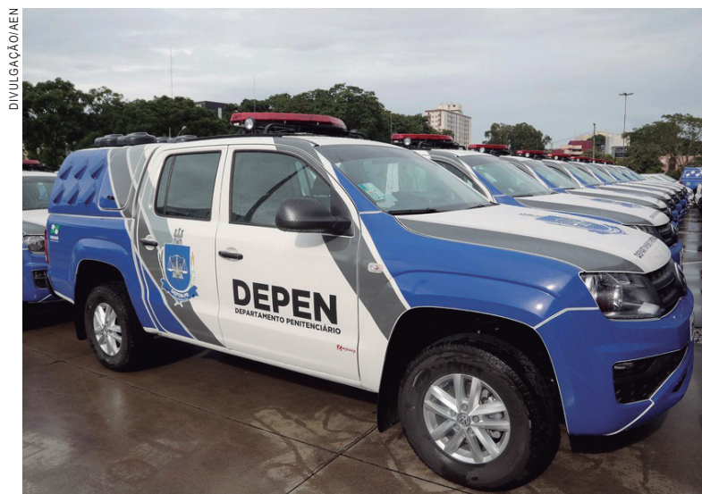
Veículos novos para o transporte de detentos