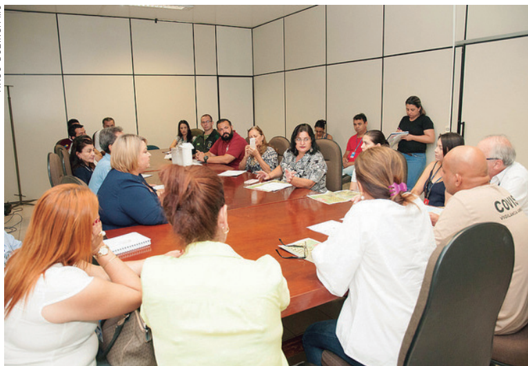
Reunião definiu estratégias da batalha contra o mosquito da Dengue

Entre as iniciativas definidas em reunião no final da semana passada, a Prefeitura buscará o apoio da imprensa para expandir a divulgação do alerta e conscientizar a população. Nos próximos dias o tema será levado aos professores, na Semana Pedagógica, e depois aos alunos nas escolas da rede municipal; a Aciu (Associação Comercial e Industrial de Umuarama) reunirá os seus associados para abordar o problema, enquanto o Sebrae fará divulgação com micro e pequenos empresários; o Sistema Fiep levará o assunto nas visitas às indústrias e também na volta às aulas dos alunos da Escola Sesi e cursos do Senai. Já os agentes de combate a endemias (ACEs) da Vigilância em