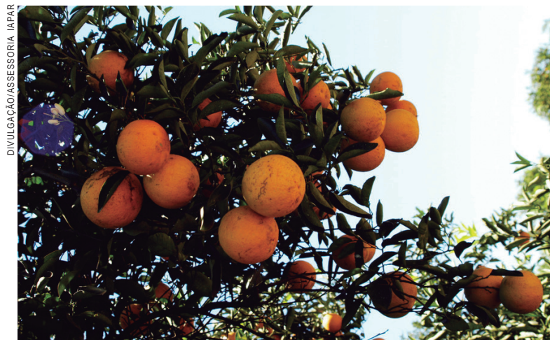
O cultivo de frutas é boa opção para melhorar a renda no campo