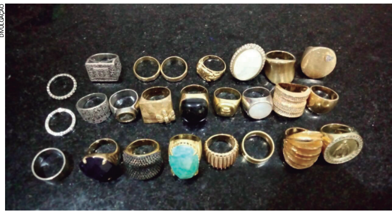
Parte das joias encontradas com os bandidos detidos. Os objetos roubados também foram reconhecidos

Um homem foi preso por atirar contra dois idosos com uma arma de pressão no início da noite do domingo (28) em Umuarama. O fato aconteceu na rua Minas Gerais e, de acordo com o denunciante, um homem estaria atirando pela janela contra pessoas que passavam em frente ao local. Ele usava uma espingarda de pressão. A Polícia Militar compareceu ao endereço e