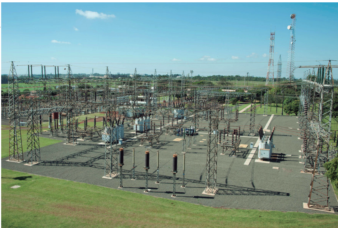
Construção de novas subestações no interior do Estado

tinuidade ao trabalho de expansão e investimento em novas tecnologias, cujo resultado já pode ser visto na prática. "Nos