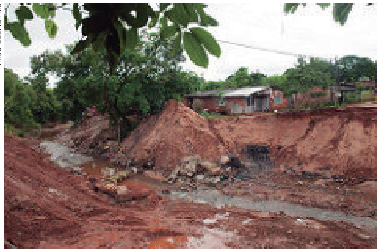
Os recursos liberados para Umuarama já têm destino certo

O valor refere-se ao pagamento do imposto por empresas que receberam incentivos fiscais do programa Paraná Competitivo para projetos de investimentos no Estado. É o segundo ano consecutivo, se-