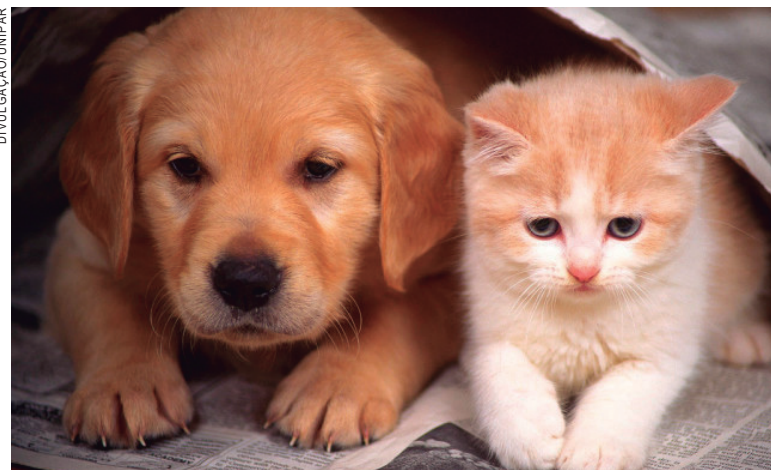
Mudança de comportamento: bichos são criados dentro de casa e, por isso, o cuidado com a saúde passa a ser essencial

compõem a matriz curricular, englobando 360 horas. Com número de vagas limitado (apenas 30), as aulas serão em regime mensal. Ex-alunos da Unipar, formados em 2017, ganham 20% de desconto nas mensalidades do curso; formados em anos anteriores, 15%; ex-alunos de cursos de especialização concluídos na Unipar ganham também desconto: 20%. Mais informações podem ser obtidas no site da Unipar ( www.unipar.br ).