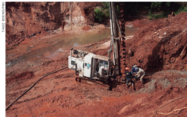
O Estaqueamento vai garantir mais estabilidade à ponte

O secretário explicou que a ponte terá 13 metros de comprimento, por cerca de 11,40 m de largura e pouco mais de 4 m de altura. As alas terão um pequeno grau de inclinação de forma a proteger o aterro, que em boa parte será preenchido com