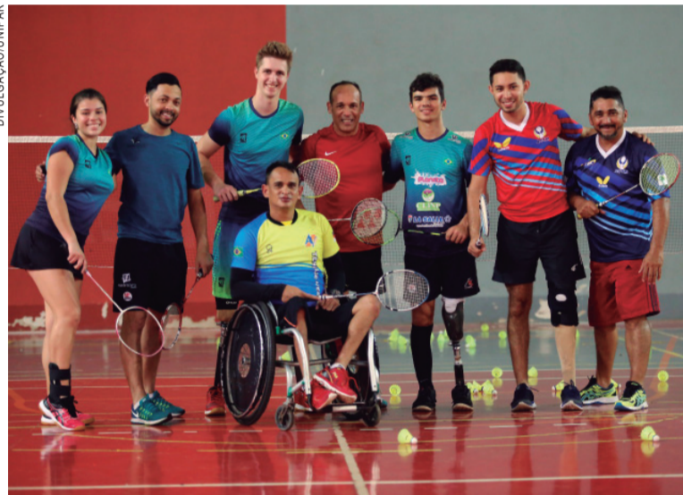
Time integra vários atletas e participa de competições em todo o Brasil

Projeto do curso de Educação Física estimula a prática e revela talentos