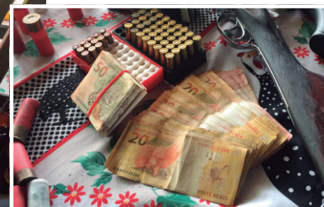
Armamentos e dinheiro apreendido, juntamente com munições e uma carga de cigarros contrabandeados do Paraguai

calibre 12, uma grande quantidade de dinheiro e um carregamento de cigarros paraguaios,