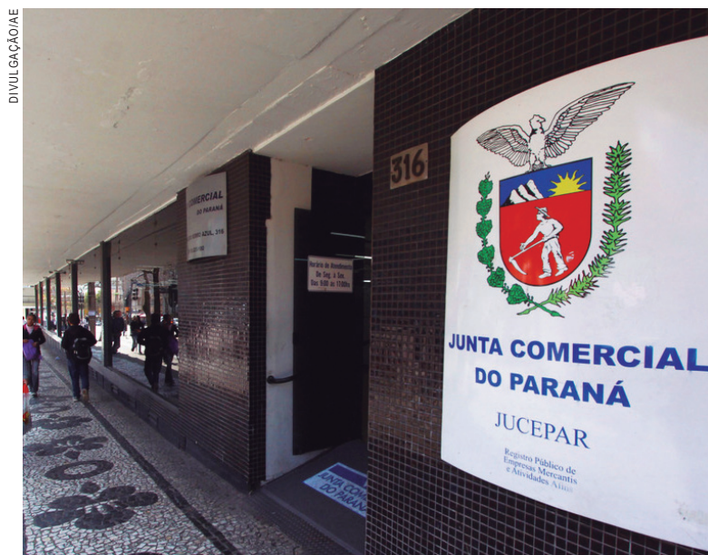
Sede da Junta Comercial em Curitiba

A mudança permite que os dados estejam exatamente iguais nos dois sistemas, o que evita a grande quantidade de