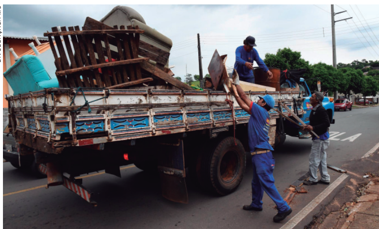
O arrastão visa recolhimento de móveis velhos, galhos e outros objetos