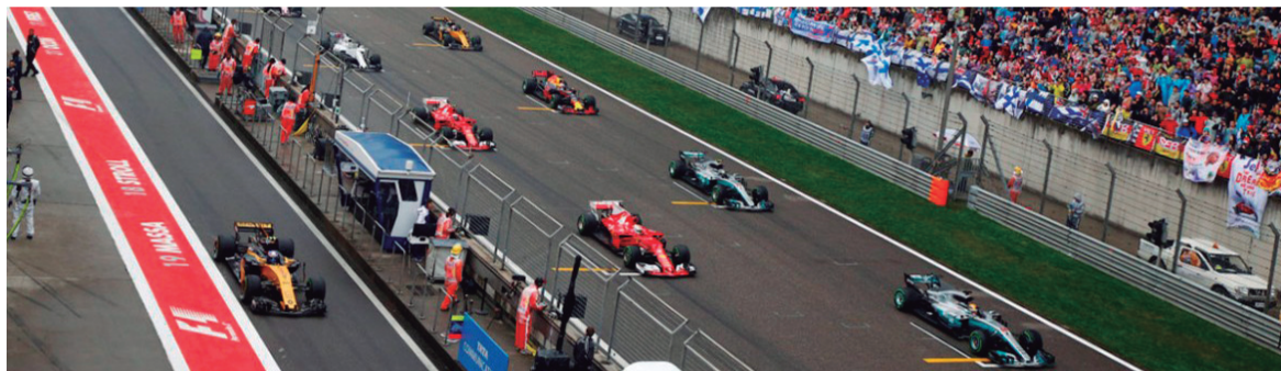
Fórmula 1, em Interlagos, sofreu alteração no horário de início da prova

Os organizadores da Fórmula 1 anunciaram ontem (01/02) várias alterações nos horários das provas do calendário do próximo campeonato, incluindo o do GP do Brasil. A prova em Interlagos vai ser disputada a partir das 15h10, do dia 11 de novembro.