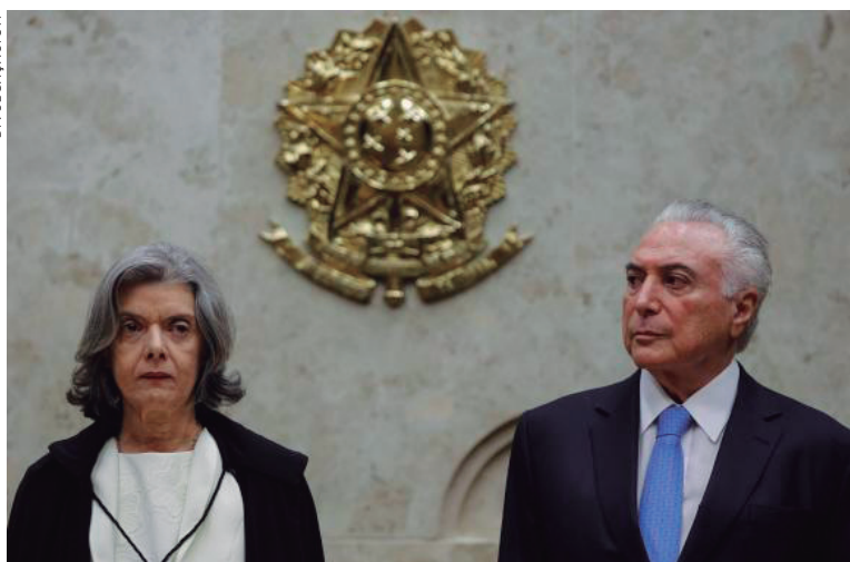
Discurso da Ministra Carmem Lúcia, ao lado do presidente Temer

"A lei é a divisória entre a moral pública e a barbárie", disse Cármen Lúcia, lembrando que o respeito à Constituição e à lei, para o outro, é a ga-