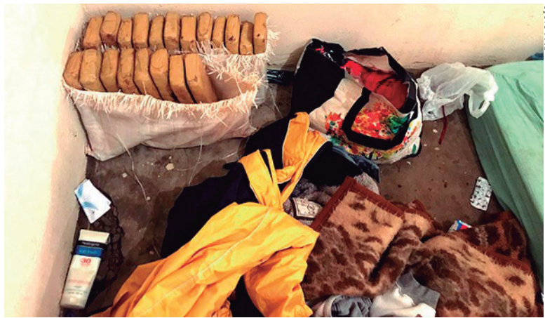
Os quase 20 quilos de maconha estavam guardados no quartos em que ficam as crianças na casa

A Polícia Civil de Umuarama apreendeu 18 quilos de maconha na manhã da sexta-feira (2) no Jardim Arco Íris. A droga estava dividida em 20 tabletes e a localização aconteceu após um trabalho de investigação do Grupo de Diligências Especiais (GDE), que fez um monitoramento à 'boca de fumo', durante aproximadamente um mês.