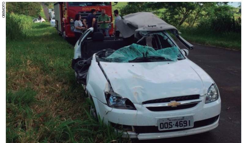
A passageira do corsa Classic ficou presa às ferragens do veículo e morreu no local