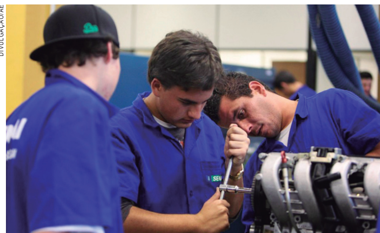
Segmento mais jovens de trabalhadores teve melhores chances

"O bom resultado do emprego para jovens é muito bem-vindo, uma vez que essa faixa etária geralmente exhibe taxas de desocupação mais altas que a média", afirmou o presidente do Instituto Paranaense de Desenvolvimento Eco-