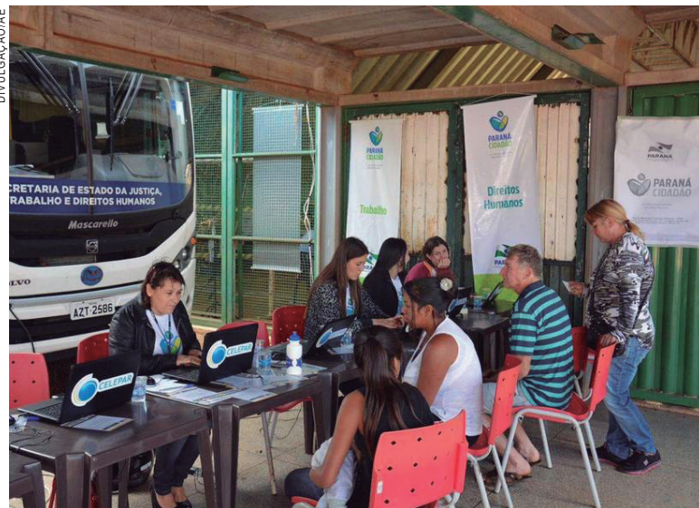
Crianças e Adolescentes receberam documentos pessoais

O Paraná Cidadão leva à população serviços gratuitos e orientação em diversas áreas, por meio de eventos realizados nos municípios, em parceria com as prefeituras e voluntários. A