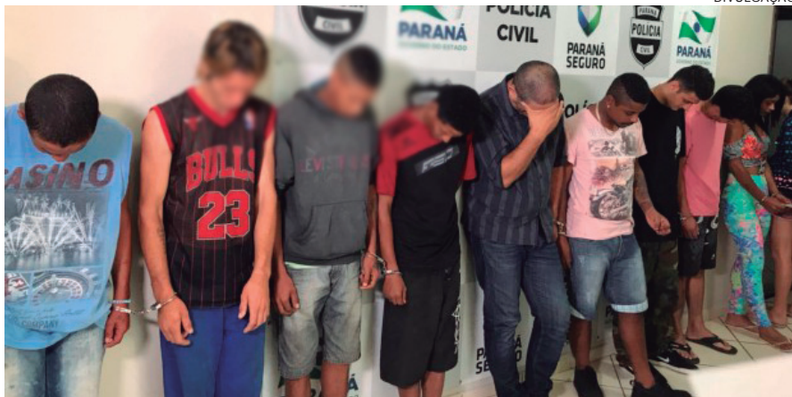
Envolvidos poderão ser responsabilizados financeiramente pelos prejuízos

A Polícia Civil até que fez o possível para manter 11 pessoas, aquelas envolvidas na depredação da Delegacia de Umuarama, recolhidas na cadeia, mas a Justiça decidiu não expedir as prisões preventivas dos acusados, que estão sendo liberados hoje do cárcere temporário.