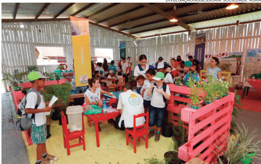
A FAZENDINHA será um atrativo a mais para o público infantil na Expo

O projeto da Fazendinha, desenvolvido pela SRU e parceiros é de responsabilidade social, dentro da proposta da Expo-Umuarama de novos horizontes para o campo e a cidade.