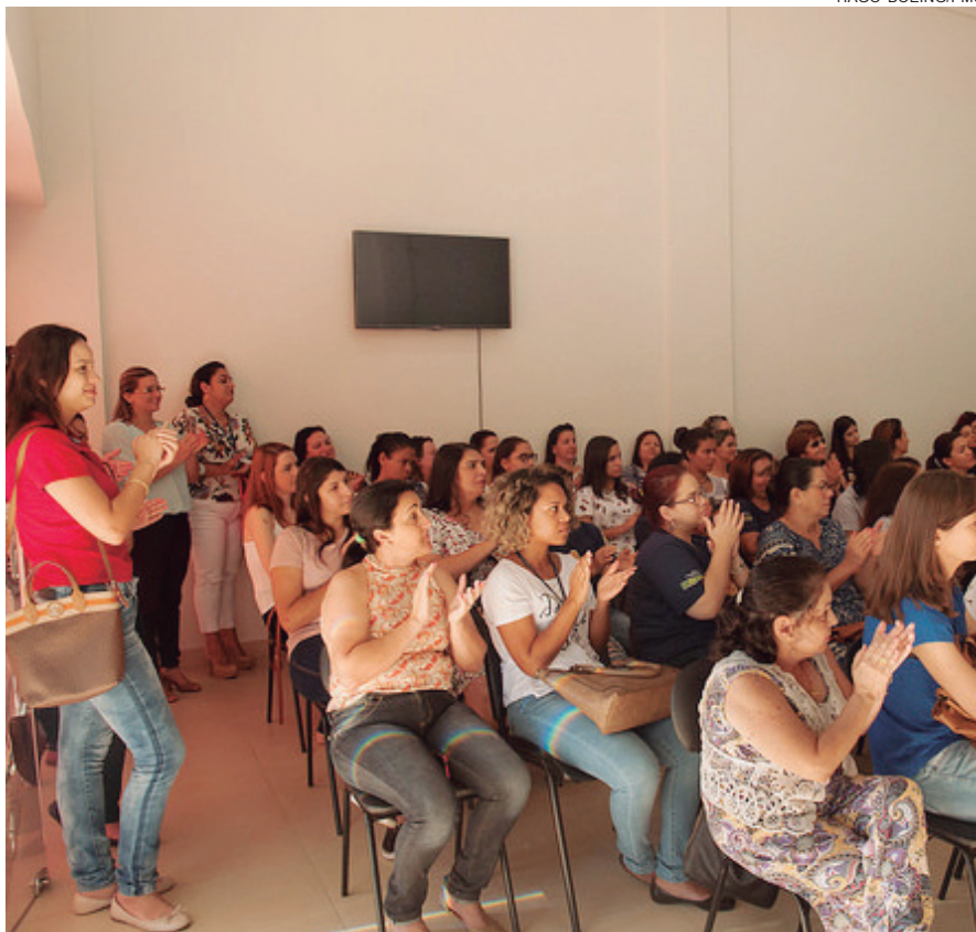
MUITAS mulheres prestigiaram o evento na Casa dos Conselhos

“O avanço da mulher na sociedade ocorre a duras penas. É resultado de muito esforço, muita luta. Hoje as mulheres são mães, esposas, trabalhadoras, profissionais respeitadas e ocupam cargos importantes de chefia e liderança, mas ainda lutamos contra o machismo e a violência neste mundo conservador”