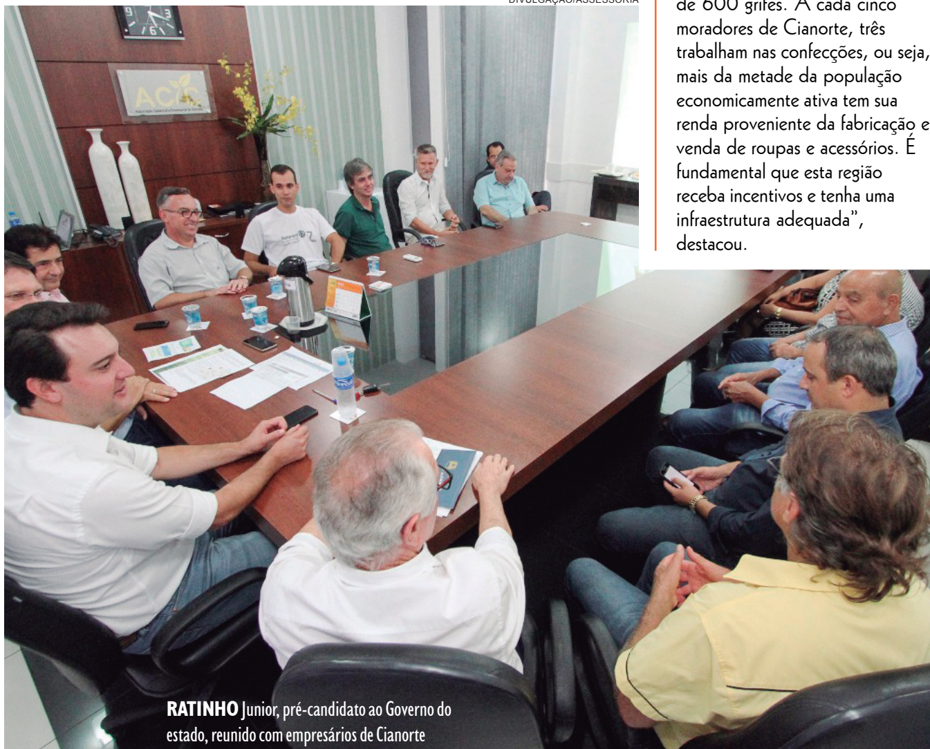
RATINHO Junior, pré-candidato ao Governo do estado, reunido com empresários de Cianorte

Em Cianorte, o deputado conheceu o polo de vestuário da região. Com cerca de 70 mil moradores, Cianorte é conhecida como a capital brasileira do vestuário, e é responsável por 20% de todo jeans comercializado no país - 12 milhões de peças por mês. “O polo formado por 50 cidades, tem 450 indústrias que ultrapassam a produção de mais de 600 grifes. A cada cinco moradores de Cianorte, três trabalham nas confecções, ou seja, mais da metade da população economicamente ativa tem sua renda proveniente da fabricação e venda de roupas e acessórios. É fundamental que esta região receba incentivos e tenha uma infraestrutura adequada”, destacou.