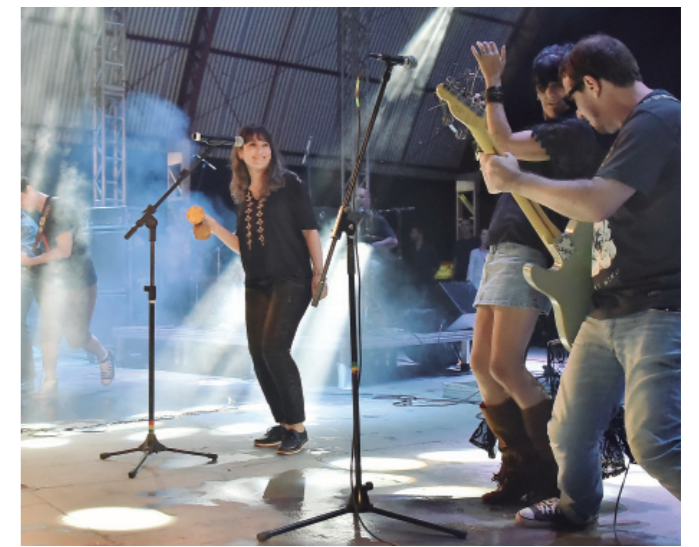
BANDA Triângulo das Bermúscas