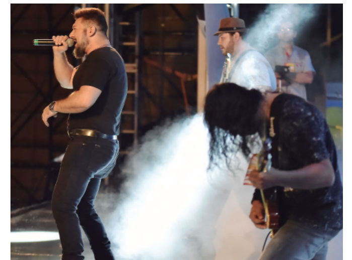
BANDA Cavern Club