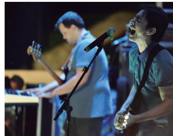
BANDA Carolina Reaper