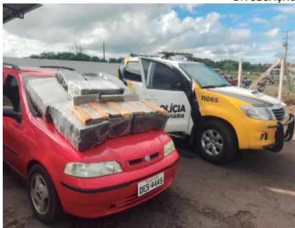
DROGA apreendida pela Polícia Rodoviária de Iporã seria levada para ser comercializada em Maringá

Na averiguação inicial, os tabletes de maconha foram encontrados dentro do Fiat Pálio Weekend ELX, de cor vermelha, licenciado em de