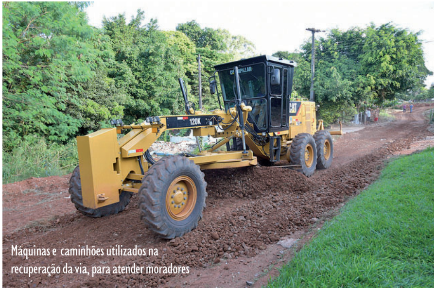
Máquinas e caminhões utilizados na recuperação da via, para atender moradores