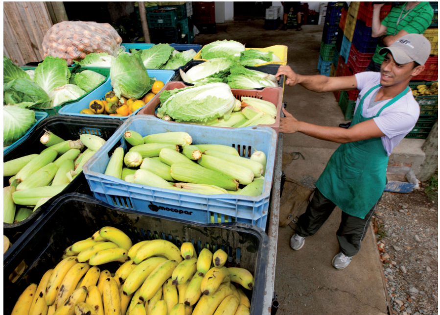
Além de reforçar o comércio entre os pequenos agricultores, a merenda oferece alimentos de qualidade

Só para a compra de alimentos da agricultura serão destinados R$ 86 milhões, o que garante renda às famílias de pequenos produtores, contribuindo para que se mantenham no campo e tenham mais qualidade de vida.