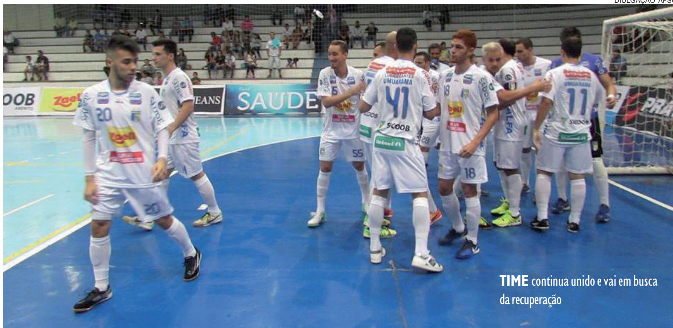
TIME continua unido e vai em busca da recuperação