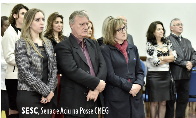
SESC, Senac e Aciu na Posse CMEG