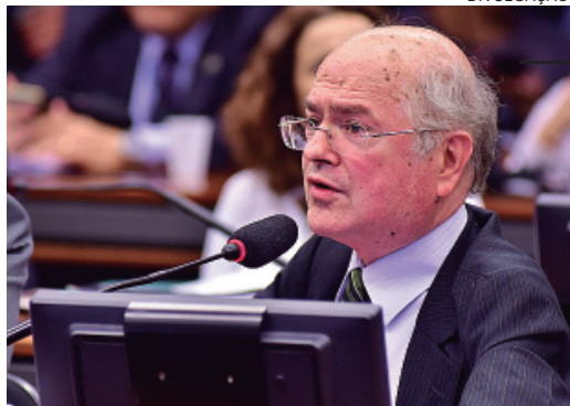
DEPUTADO federal Alfredo Kafer, direcionando recursos para o setor de saúde, no Paraná

O deputado Alfredo Kafer (Progressistas-Pr) liberou nesta semana cerca de R$ 3,6 milhões para aplicação na saúde dos paranaenses. Os recursos, que serão investidos na compra de ambulâncias e Kit odontológicos, foram destinados a cerca de trinta municípios. “Essas ambulâncias e os kits odontológicos também são fruto de muito trabalho, e sei que ajudarão as administrações a atenderem ainda melhor o cidadão”, disse Kafer.