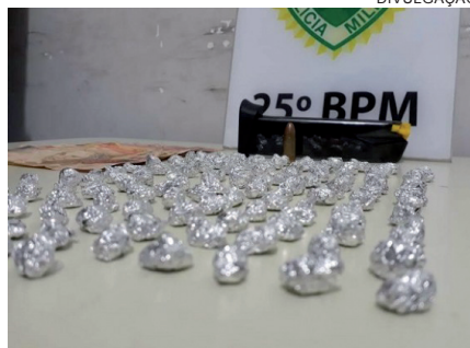
TRAFICANTE confessou que vendia drogas há 3 anos na estação rodoviária

Ele teria sido flagrado pelos policiais ao desenterrar – num gramado ao lado do terminal – 15 pedras de crack. Durante a abordagem – que já resultaria no encaminhamento do rapaz até a delegacia sob acusação de estar traficando entorpecente – os militares descobriram que o detido escondia mais pedras de crack em sua casa, no Jardim Petrópolis.