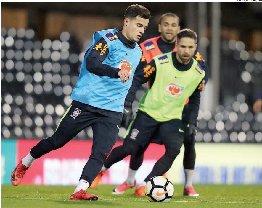
JOGADORES treinam para o amistoso com a Croácia

Na atividade desta terça no CT do Tottenham, por exemplo, o trei-