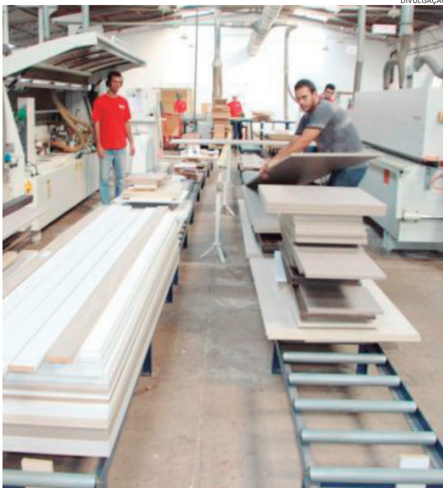
A INDÚSTRIA moveleira depende de receber matéria prima

Ariovaldo informou que o sindicato abrange uma área onde estão mais de 100 indústrias, com mais de 1.000 funcionários. "Estão todos preocupados com essa situação". As maiores, Hellen Estofados e Umflex, contam inclusive com frotas de caminhões. Muitos desses caminhões estão paradas na estrada em decorrência dos bloqueios. A maioria está nos pátios das empresas aguardando a normalidade. Para o sindicalista, se a paralisação se encerrar hoje, as empresas deverão demorar uma semana para normalizar a atividade fabril.