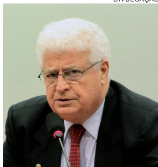
DEPUTADO federal Nelson Meurer, do Paraná, é o primeiro da lava-jato no STF

É a primeira ação penal da Operação Lava Jato julgada pela Segunda Turma da Corte após a chegada dos primeiros inquéritos, em 2015. O julgamento prossegue para a tomada de votos dos ministros Ricardo Lewandowski e Gilmar Mendes. Já votaram pela condenação o relator, Edson Fachin, e os ministros Celso de