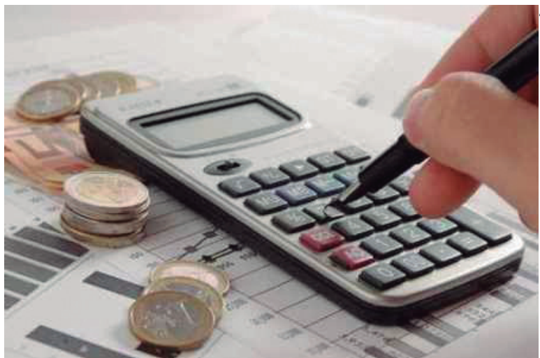
Pagardívidas, exige planejamento, para melhor aproveitamento do dinheiro

Um levantamento realizado pelo Serviço de Proteção ao Crédito (SPC Brasil) e pela Confederação Nacional de Dirigentes Lojistas (CNDL) sobre organização do orçamento para 2018 mostra que apenas 15% dos brasileiros dizem ter condições de pagar as despesas sazonais deste início de ano, como IPTU, IPVA e material escolar, com os próprios rendimentos. A pesquisa ainda mostra que 17% dos entrevistados não fizeram qualquer planejamento para pagar esses compromissos no início de 2018.