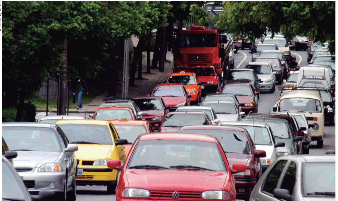
Todos os veículos devem ter o Seguro Obrigatório, que é o DPVAT