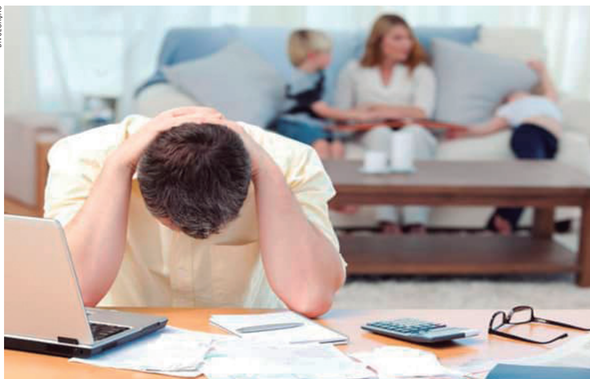
Grande parte do endividamento é por uso do cartão de crédito

10,3%. A CNC destaca, na publicação, a redução do financia-