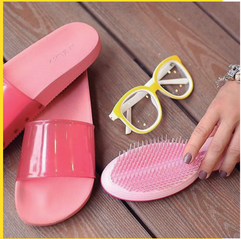
A coqueluche das férias

Sem dúvida, os queridinhos slieds estão reinando nos pés das fashionistas na coleção verão 2018. Despojados, confortáveis e estilosos, podem ser usados com shorts, jeans, macaquinhos e vestidos casuais. Ah, na praia e piscina também vale muito a pena usar. As lojas Empório dos Calçados dispõem de vários modelos de slieds a partir de R$ 29,90. Vale a pena conferir!