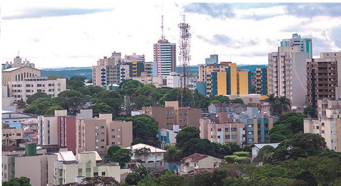
Umuarama apresentou crescimento de 111,9% no PIB estadual

O município de Umuarama teve variação positiva de 111,9%