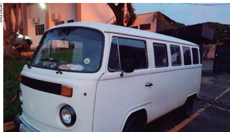
Kombi furtada foi recuperada pela PM depois de uma fuga do autor do crime pela rodovia PR 323 entre a Havan até o Parque Bonfim

Conduzido à delegacia, o detido foi identificado e a tornozeleira usada por ele estava instalada por conta de um benefício concedido pela Justiça para que