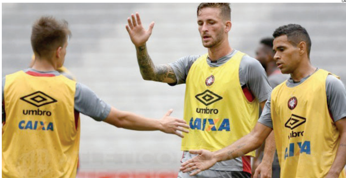
Atlético venceu o Inter de Lages por 3 a 1