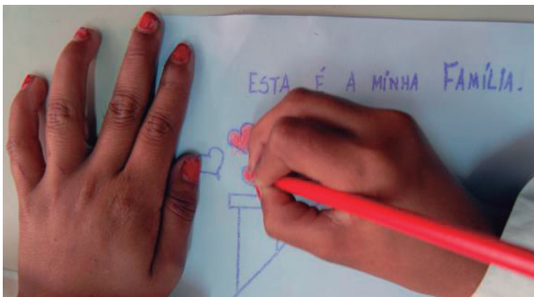
A idéia é a alfabetização da criança com dois anos de escola

O Ministério da Educação (MEC) escolheu o Ceará para começar a elaborar as estratégias de implantação da Base Nacional Comum Curricular (BNCC) para a educação infantil e o ensino fundamental. As diretrizes, que definem a aprendizagem essencial que todos os alunos, tanto na rede pública como particular, devem adquirir na escola, foram homologadas em dezembro e entram em vigor em janeiro de 2019.