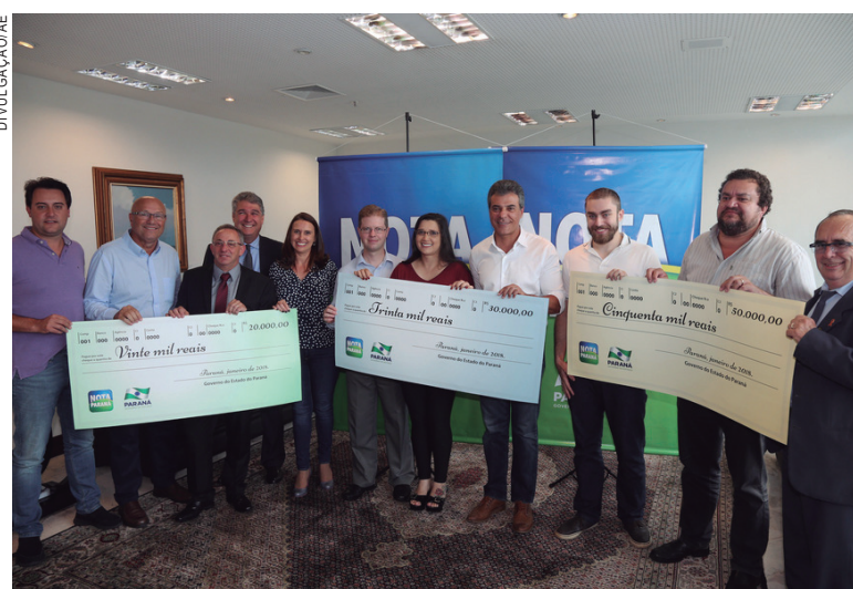
Ganhadores recebem o cheque demonstrativo referente ao prêmio

No mês de janeiro, o Nota Paraná atingiu a marca de 1,986 milhão de pessoas cadastradas - já prestes a bater a marca de 2 milhões de participantes. Desde o lançamento, em agosto de 2015, o programa já disponibilizou