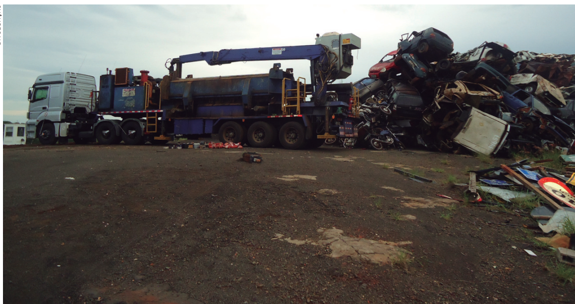
Objetivo é manter os depósitos em boas condições sanitárias e prontos para receber novas apreensões

exigências foram tão rígidas que apenas duas empresas no