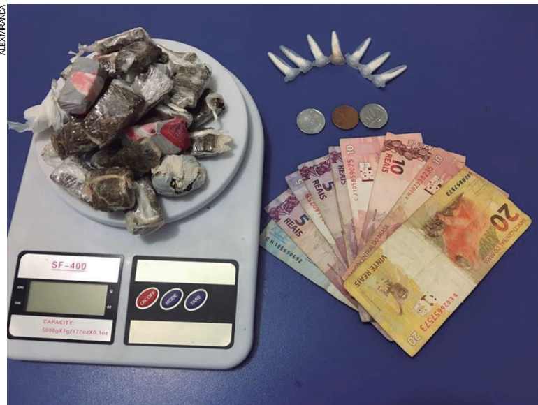
Maconha e cocaína apreendidas com garotos de 14 e 16 anos foram recolhidas pela PM, jovens alegaram serem usuários e foram liberados

Depois que os jovens foram encaminhados à Delegacia de Polícia, a mãe de um deles acompanhou a tramitação que seguia com a apreensão do garoto.