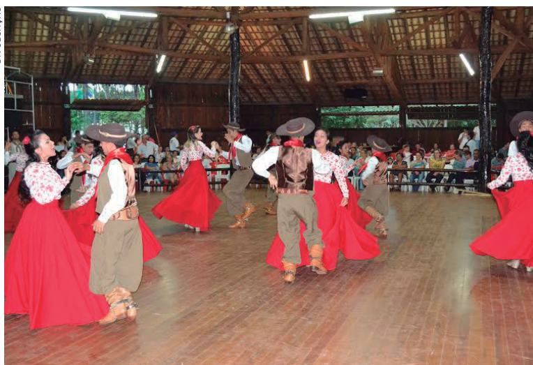
O Congresso debaterá o futuro das tradições gaúchas no Paraná

Centros de Tradições Gaúchas em suas assembleias regionais.