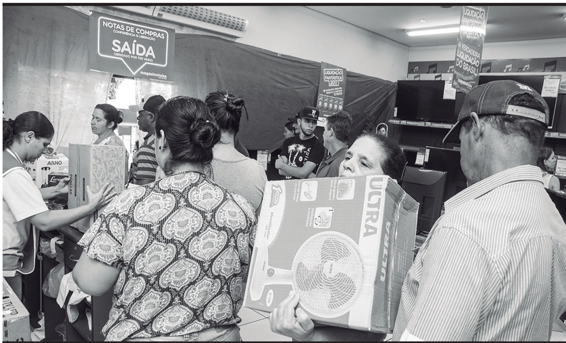
THIAGO CASONI/COGITO COLETIVO