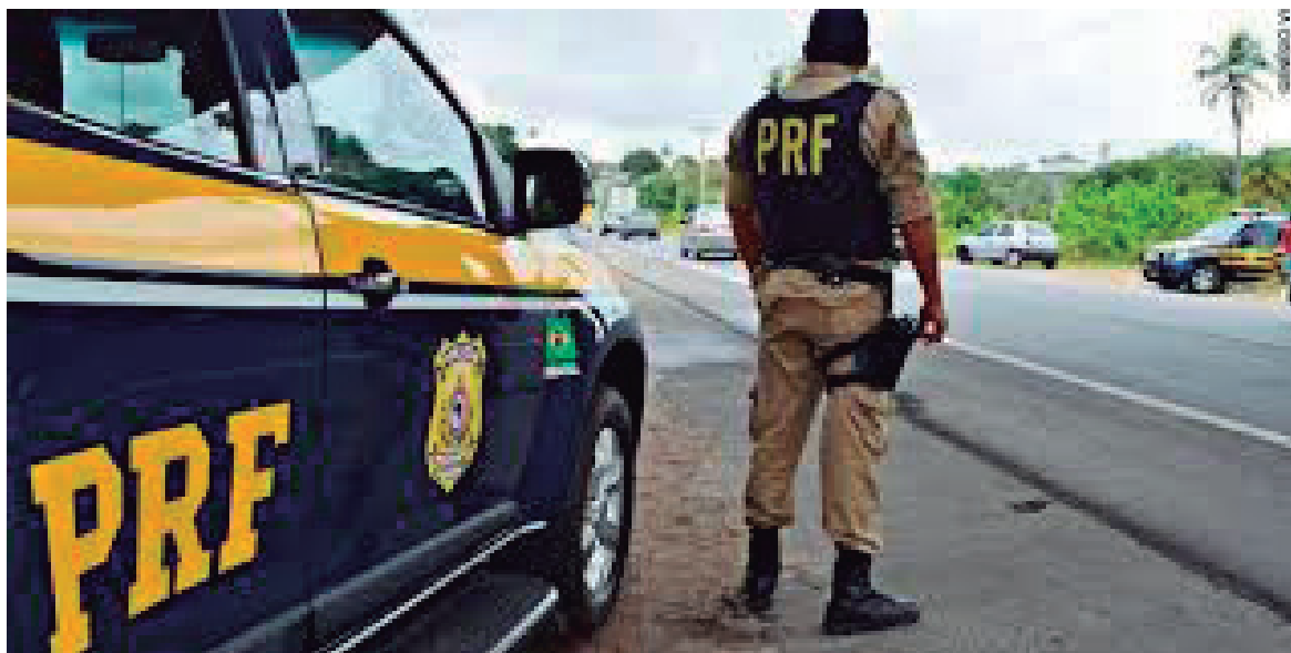
A Polícia Rodoviária Federal tem intensificado a fiscalização no Paraná

A falta de atenção dos motoristas brasileiros foi a principal causa dos acidentes de trânsito ocorridos ao longo do ano passado, segundo a Polícia Rodoviária Federal. Segundo balanço divulgado hoje (19) pelo órgão, só nas rodovias federais foram registrados 89.318 acidentes graves, resultando na morte de 6.244 pessoas e 83.978 feridos.