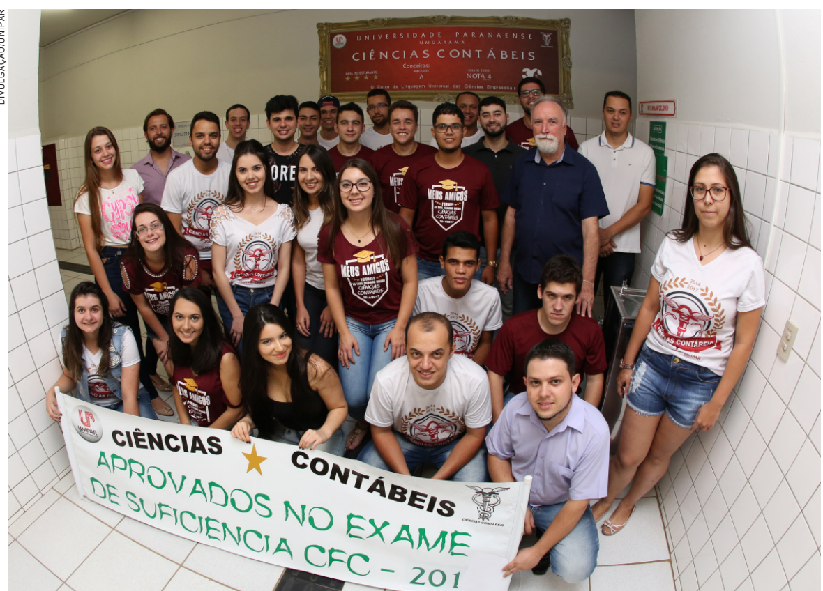
Formando de Contábeis comemoram o ingresso no CFC

aprovação também à excelente qualidade do projeto pedagógico do curso oferecido pela Unipar. "A Universidade foi o guia principal, pois soube nos ensinar o caminho certo, inclusive as aulas preparatórias para o exame foram muito coerentes com a prova. Os professores sempre antenados e ensinando o que realmente seria pedido. Com essa conquista, me sinto pronta e confiante para ingressar no mercado de trabalho", avalia. "O alto nível de aprovação no exame comprova que estamos em sintonia com as exigências dos órgãos reguladores, bem como com os ambientes em que estão inseridos nossos acadêmicos e ex-alunos", ressalta o coordenador, enaltecendo que é gratificante saber que a Unipar trabalha incansavelmente na busca da qualidade do ensino. "Com um corpo docente comprometido com as nossas pro-