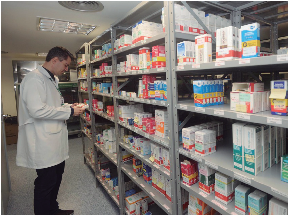
Nas unidades de farmácias pelo interior do Estado, a presença do profissional

No dia 20 de janeiro é comemorado o Dia do Farmacêutico. A data foi escolhida em função da fundação da Associação Brasileira de Farmacêuticos (ABF), em 20 de janeiro de 1916. Na época, era a maior instituição representativa da categoria, no País.