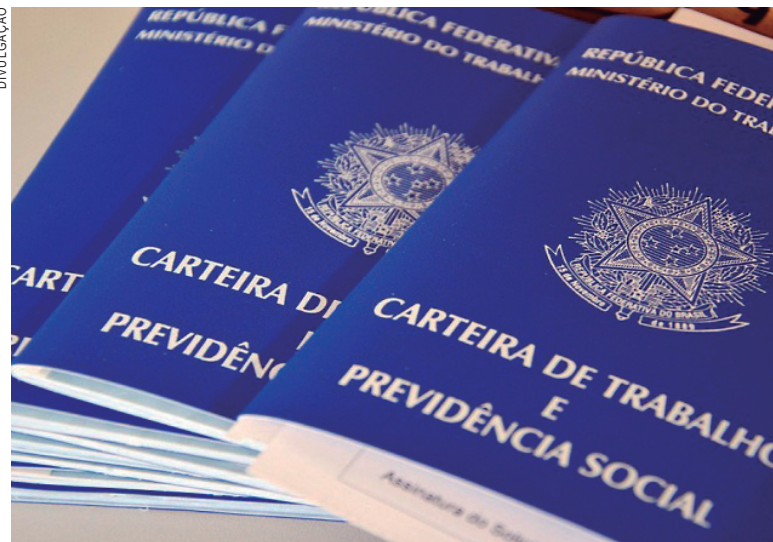
Apesar da Carteira Digital, procura pelo documento ainda é grande