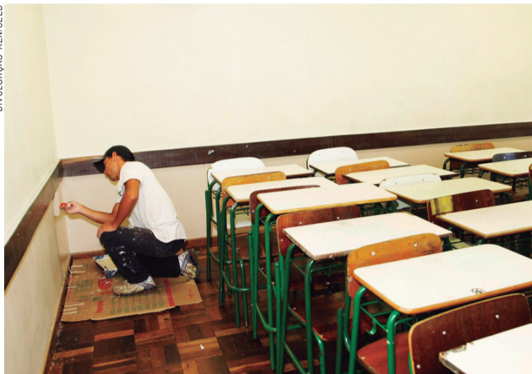
Escolas devem estar prontas para ok início do ano letivo

veu toda a comunidade escolar em audiências públicas para decidir onde aplicar os recursos. Foi uma decisão muito democrática e transparente de toda a comunidade escolar", disse.