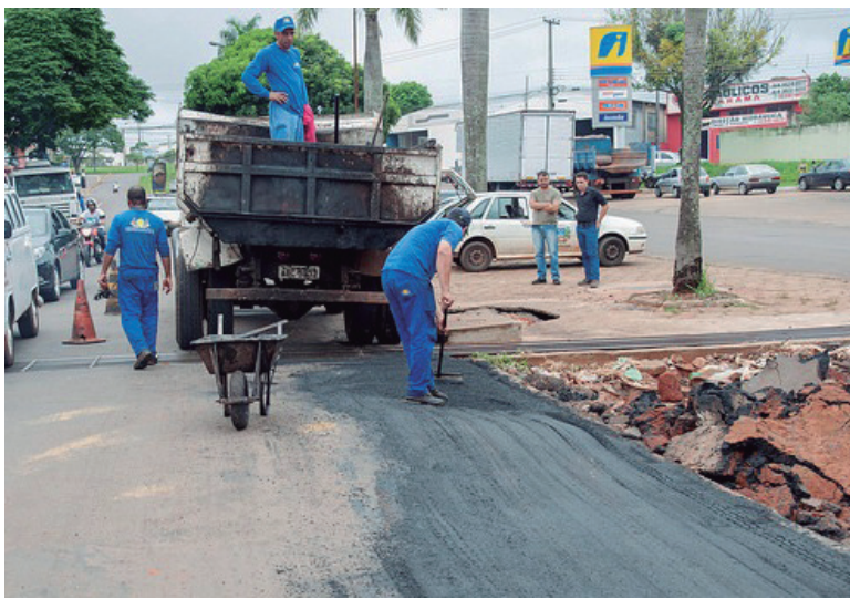
Equipes aproveitam a estiagem para recuperar o asfalto

“Estamos dando uma atenção especial para a recuperação do asfalto, além de restaurar locais atingidos por erosões. A malha viária da cidade foi seriamente danificada, inclusive em pontos de grande movimento.