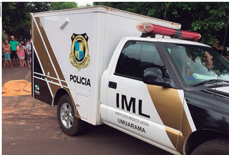
Vítima do terceiro homicídio do ano foi executado com tiro na cabeça no Parque das Jabuticabeiras

discutido por causa de um cachorro", relata o policial..