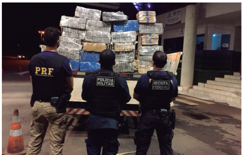
O caminhão que estava transportando 548 quilos de maconha em Guairá, na BR-163, foi apreendido

A Polícia Rodoviária Federal (PRF), a Receita Federal (RF) e a Polícia Militar de Mato Grosso do Sul (PMMS) apreenderam, na madrugada da segunda-feira (22), um caminhão que estava transportando 548 quilos de maconha em Guairá, na BR-163. A droga