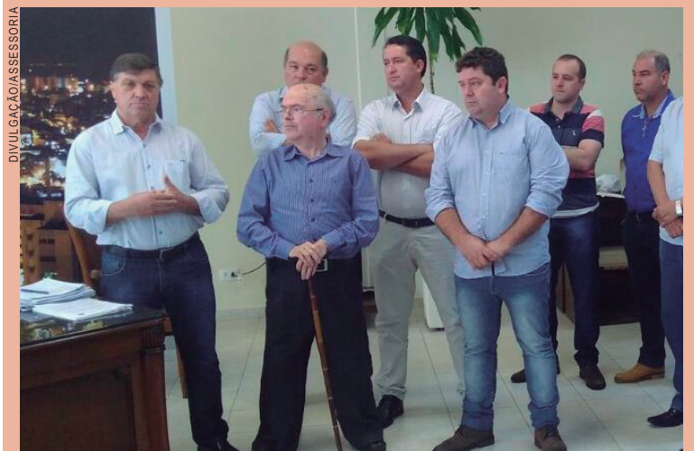
O deputado Alfredo Kaefer foi recebido pelo prefeito Pozzobom, no gabinete

Ainda no sábado pela manhã, antes do encontro com o Ministro da Saúde, o prefeito Celso Pozzobom recebeu em seu gabinete o deputado federal Alfredo Kaefer, que confirmou ao prefeito o repasse de recursos de emenda de sua autoria, também para serem aplicados na área de saúde do município. Para Pozzobom, os recursos anunciados pelo deputado são extremamente importantes e reforçam o trabalho que a administração vem desenvolvendo especialmente no setor de saúde, para melhorar o atendimento à população.