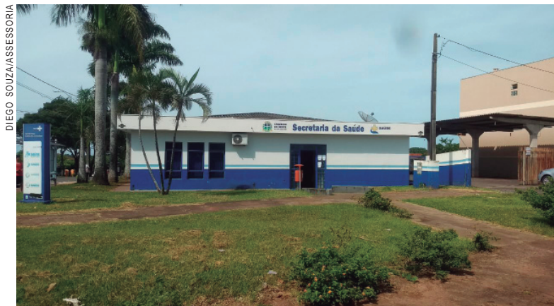
Secretaria de Saúde de Cruzeiro do Oeste