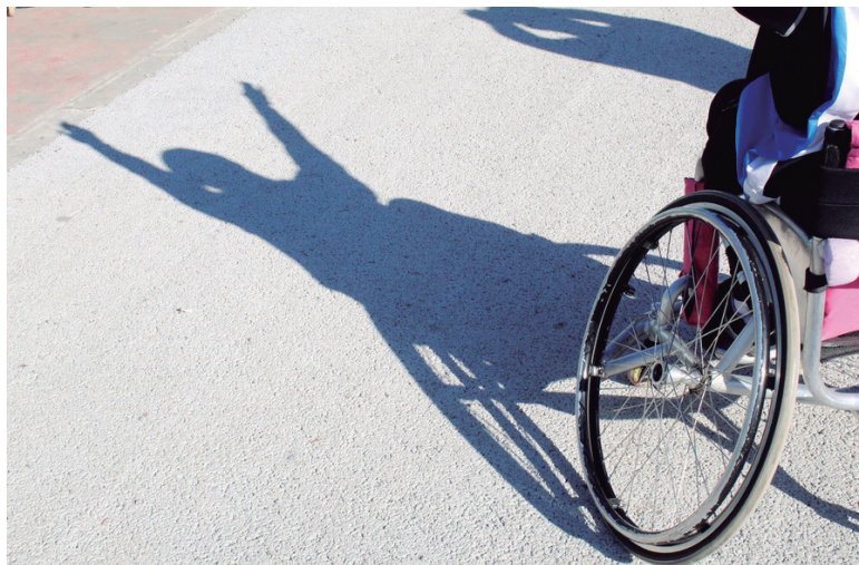
O Plano representa avanço no que se refere a acessibilidade

O primeiro Plano Estadual dos Direitos da Pessoa com Deficiência do Paraná já está disponível pela internet, em formato que permite a programas de computador traduzirem o texto escrito em áudio. As versões impressas, que incluem, além da padrão, uma para quem tem baixa visão e outra em braille, serão distribuídas pela Secretaria de Estado da Família e Desen-