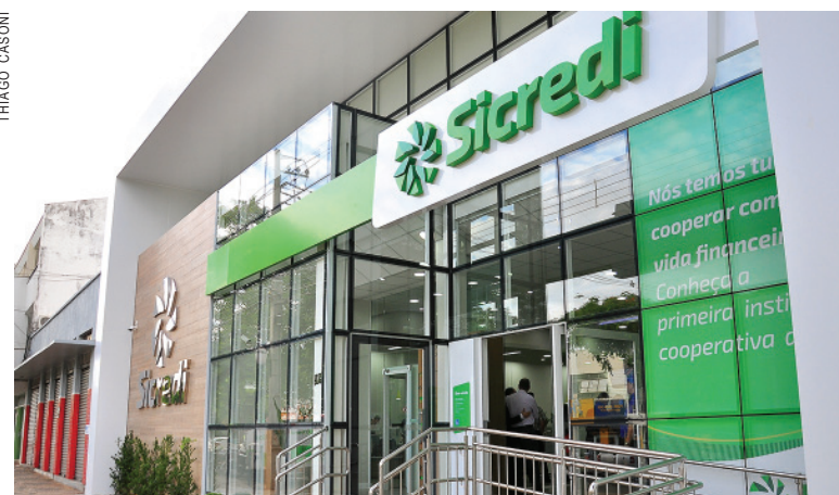
Unidade do Sicredi em Umuarama

Outro ponto que estará em pauta durante as Assembleias é o planejamento para 2018. Além disso, haverá espaço