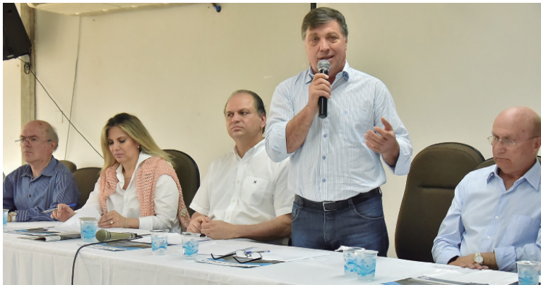
O prefeito Celso Pozzobom aproveitou para agradecer. Ao lado dele o deputado Osmar Serraglio, o Ministro Ricardo Barros, a vice-governadora Cida Borgheti e o deputado federal Alfredo Kaefer

relatório de suas ações à frente do Ministério. Ele é deputado federal e está licenciado do cargo há três anos, para exercer a função, e tem recebido elogios de segmentos do Governo quanto ao seu desempenho. Na prestação de contas, o Ministro, que estava acompanhado também da vice-governadora Cida Borgheti, demonstrou conhecimento da situação da saúde no Brasil e do funcionamento do Ministério. Mostrou avanços e pro-