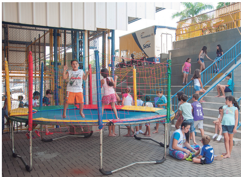
As crianças têm ambiente saudável para brincar e interagir

O projeto Brincando nas Férias de Verão, que conta 100 vagas disponíveis para crianças de 05 a 12 anos no horário das 13h30 as 17h30, começou on-