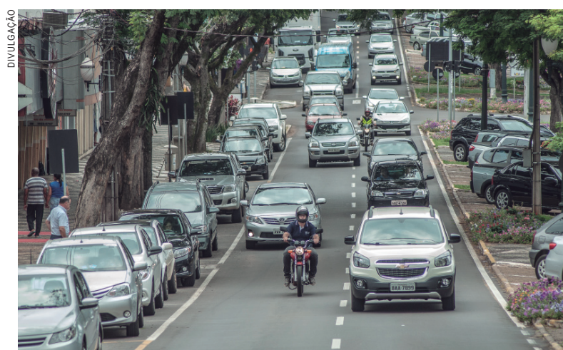
O IPVA é uma das principais fontes de recursos de Umuarama

Os contribuintes já começaram a receber em seus endereços os boletos com os dados dos veículos tributados, valor do IPVA e as guias com opção para pagamento à vista (já calculado o desconto) ou da primeira e segunda parcelas, que poderão