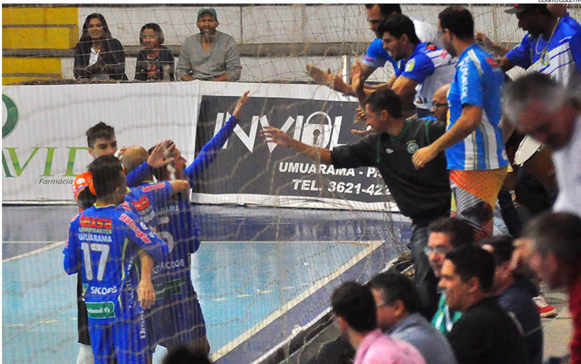
Neste ano, o torcedor umuaramense pode ficar sem esses momentos de alegria proporcionados pelo Futsal.

O mesmo time da AFSU foi convocado para representar Umuarama nos Jogos Abertos do Paraná-JAPs e sagrou-se campeão em Apucarana.