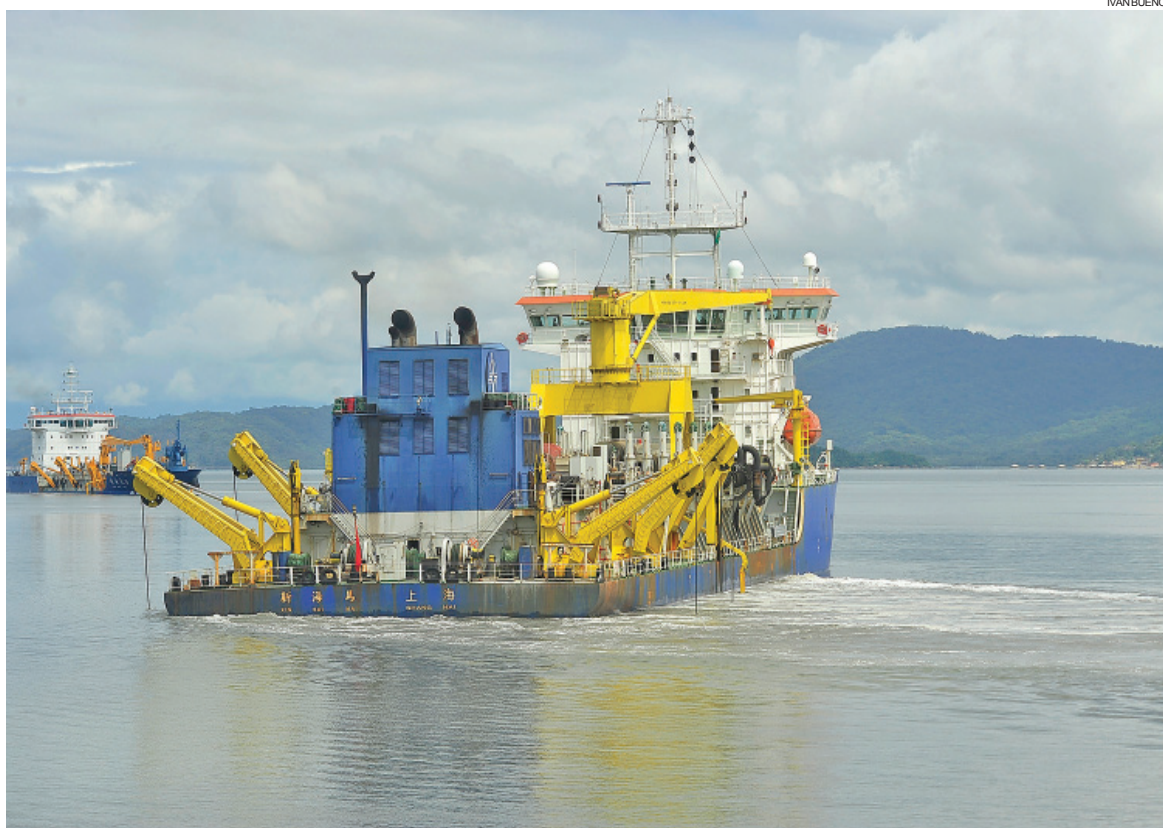
Dragagem de manutenção continuadas nos portos do Paraná é o tema da audiência pública

A realização da audiência pública está amparada nos artigos 39 da Lei Federal 8.666/1993 e 83 da Lei Estadual 15.608/2007, que tratam sobre os procedimentos para licitações e contratações feitas pela administração pública direta e indireta, incluindo as empresas estatais.