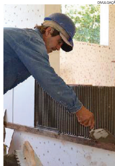
Empresa responsável pela obra estava assentando azulejos, construindo muro e trabalhando no projeto elétrico na UBS

Com a anuência do Ministério Público Federal, o Município busca nos próximos dias a retomada das obras na Avenida Olímpico Rafagnin.