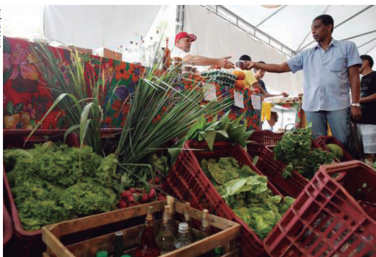
Preços dos alimentos se mantiveram baixos

As outras seis classes de despesas do IPC-C1 tiveram infla-