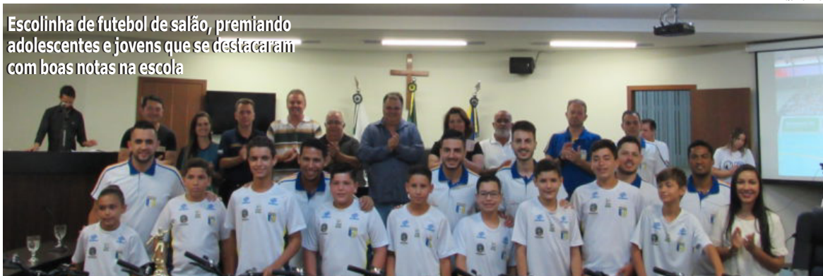
Escolinha de futebol de salão, premiando adolescentes e jovens que se destacaram com boas notas na escola