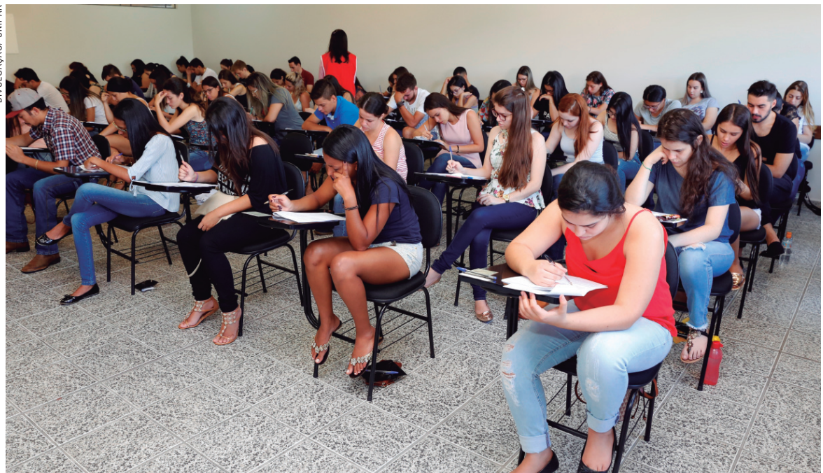
Candidatos durante a prova do Módulo I; nova chance é ofertada