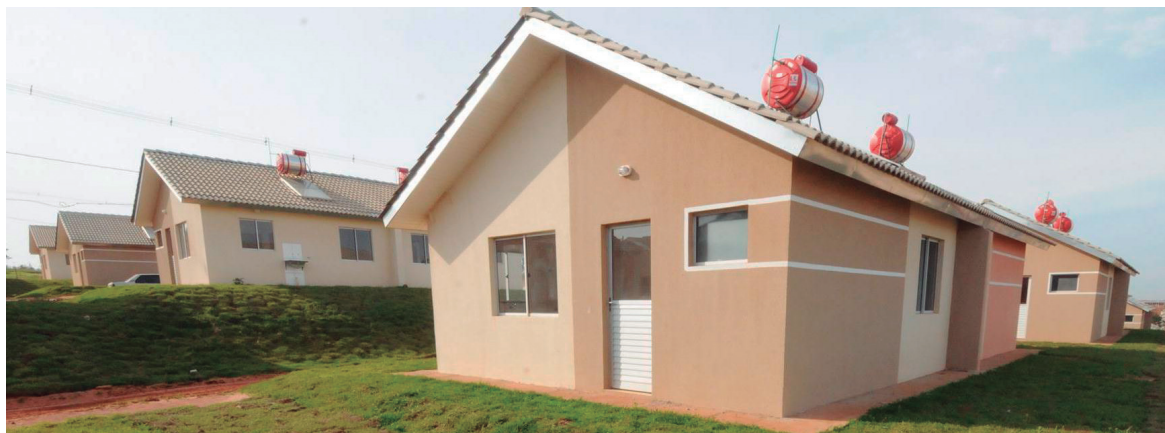
O programa de casas populares deverá retornar ajudando a movimentar a economia

O ministro das Cidades, Alexandre Baldy, informou hoje (8) que o governo deve retomar este ano as obras de 70 mil unidades do Programa Minha Casa, Minha Vida em todo o país que estavam paradas. Baldy manteve a previsão de entrega de 75 mil novas moradias do programa ainda no primeiro trimestre.