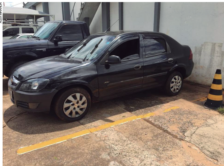
Veículo tomado de assalto em novembro, foi recuperado abandonado em canavial

via sido tomado de assalto na noite de 8 de novembro do ano passado, quando três bandidos, que se passavam por policiais, abordaram as vítimas, que foram abandonadas às margens da rodovia PR 323. Apenas o carro é que foi levado na ocasião e, após sua localização, o Prisma foi deixado na delegacia para ser restituído ao proprietário.