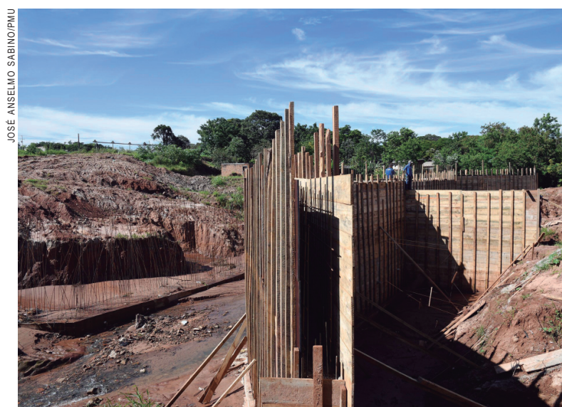
Obras continuam em ritmo acelerado

A obra foi iniciada em novembro e segue em ritmo acelerado e a conclusão está prevista para 24 de abril, com um custo estimado de R$ 1,2 mi-