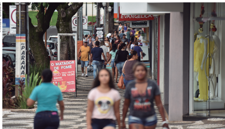
As promoções estarão em lojas por toda a cidade

Mais de 300 lojas aderiram à promoção Umuarama Liquida e devem disponibilizar produtos com descontos de até 80% entre quinta-feira (11) e sábado (13). A campanha é coordenada pelo Conselho da Mulher Empresária e Executiva da Aciu (Associação Comercial, Industrial e Agrícola de Umuarama) e desde 2014 não era realizada na