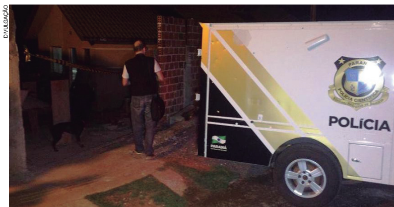
Polícia isolou o local até a chegada dos peritos que recolheram estojos de cartuchos deflagrados