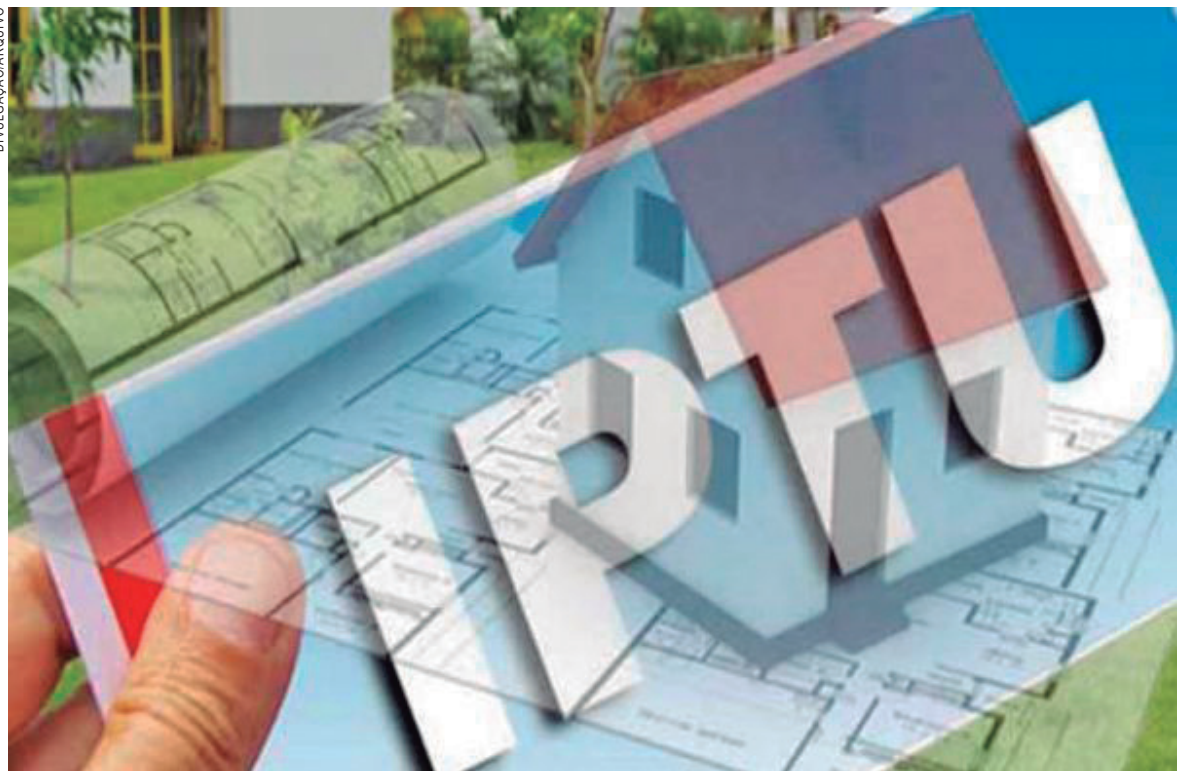
Os correios têm até o dia 8 de fevereiro para realizar a entrega

Outra informação importante é quanto às famílias que possam ter direito a isenção do imposto. A partir de março devem protocolar requerimento junto à prefeitura. Através do Decreto 001/2018, que regulamenta o lançamento e cobrança do IPTU para este ano, ficou determinado a apresentação do requerimento e enquadramento aos critérios, que no ano passado eram: possuir apenas um imóvel e renda familiar de no máximo dois salários mínimos. Os comprovantes devem ser juntados ao requerimento, inclusive certidões de cartório sobre propriedades. Segundo o prefeito, o objetivo é beneficiar àqueles que realmente precisam.