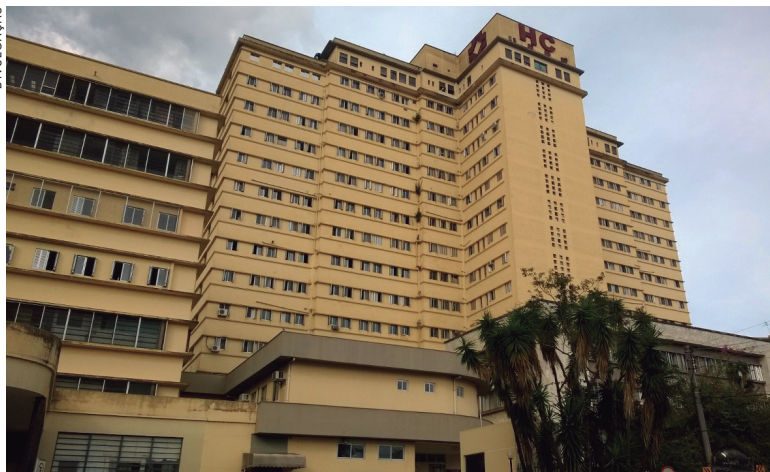
O Hospital das Clínicas de Curitiba, vai receber a maior parcela de recursos

De acordo com o MEC, é a primeira vez que a liberação é realizada no começo de janeiro. "Essa liberação confirma nosso compromisso em começar o ano de 2018 com verbas para investimentos e custeio de materiais para as unidades", disse o ministro da Educação, Mendonça Filho, acrescentando que "desde o início da gestão temos dado uma atenção especial aos hospitais universitários federais. Nosso objetivo é garantir que eles continuem prestando serviços de qualidade nas áreas de ensino, pesquisa e assistência à população".