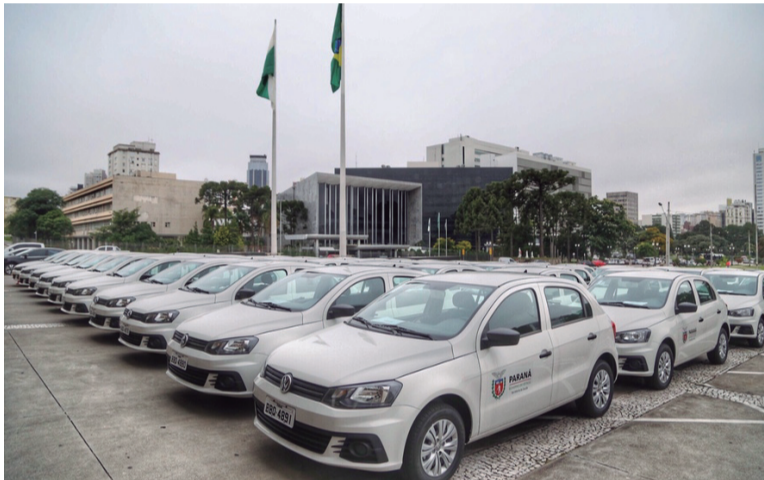
Estado repassou, em sete anos, 4 mil veículos para saúde dos municípios

"Investimos R$ 179 milhões na ampliação da frota para a saúde", afirmou Richa na solenidade, realizada no Palácio Iguazu, em Curitiba, com a presença de prefeitos, deputados e do secretário de Estado da Saúde, Michele Caputo Neto. De 2011 para cá, foram repassadas 1.000 ambulâncias a municípios, consórcios, hospitais e Siate - para melhorar o transporte de pacientes em situações de urgência.