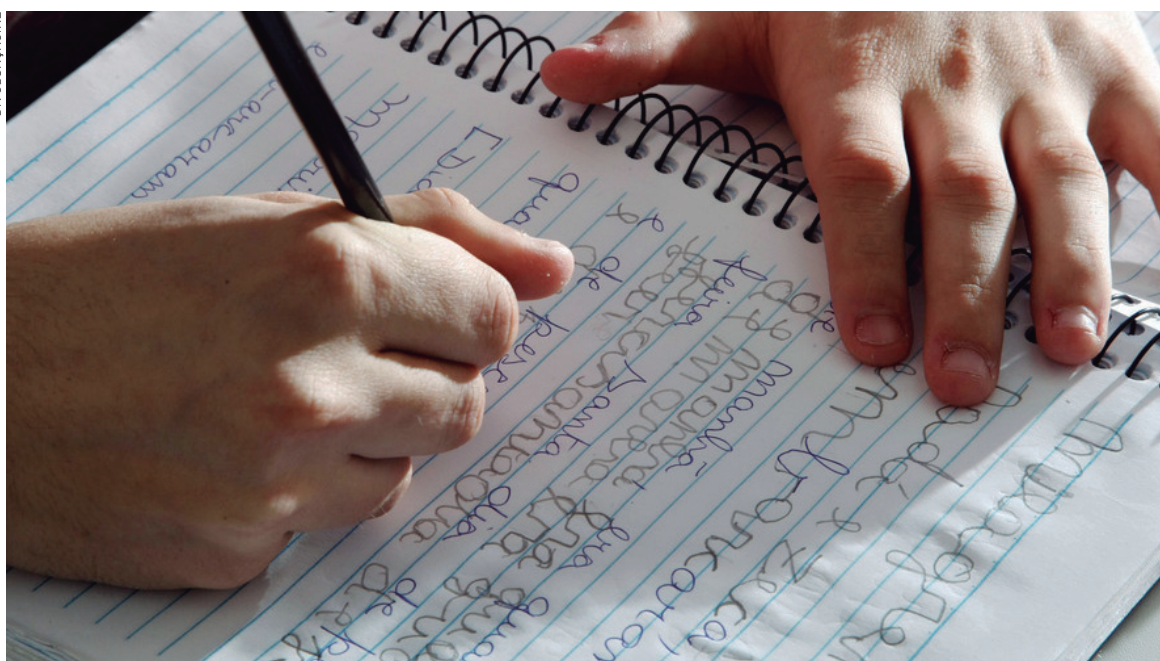
O programa visa erradicar o analfabetismo no Estado

responsável por localizar, mobilizar e cadastrar jovens a partir de 15 anos, adultos e idosos