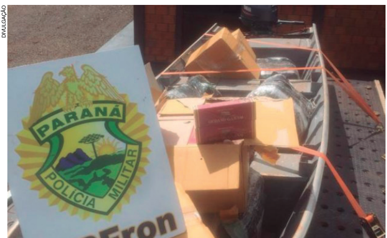
Mercadoria contrabandeada chega em território nacional através de embarcações

Em Francisco Alves, naquela mesma tarde, uma residência foi monitorada depois que denúncias anônimas levaram PMs até o