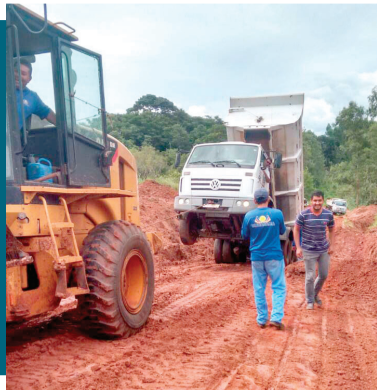
JOSE ANSELMO SABINO/PMU