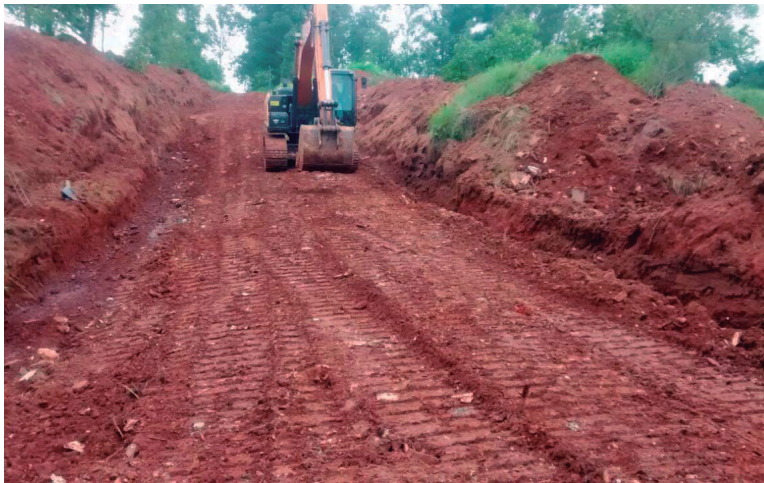
Máquinas trabalham em estrada do interior do município

lhorias em aterros, pontes, adequação de leito e outros serviços. Nos últimos dias a secretaria tem mobilizado equipes para reparos emergenciais, a fim de restabelecer o tráfego na zona rural. Nesta terça-feira, 9, uma equipe recuperou trecho da Estrada Colibri onde surgiu uma