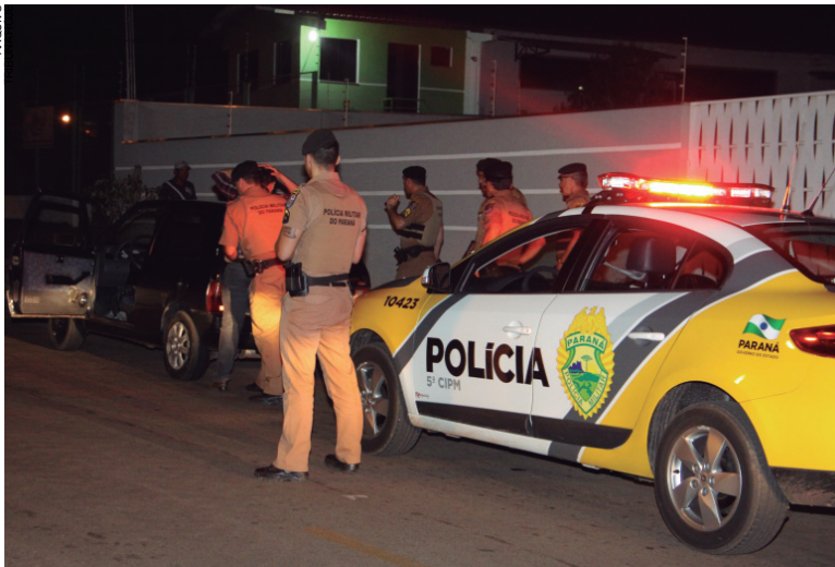
Militares realizam abordagens, averiguações e cumprem mandados judiciais diariamente a fim de retirar de circulação pessoas procuradas pela Justiça

tenham envolvimento em crimes, é grande” explica, ressaltando que em muitos casos pessoas encaminhadas e até denunciadas, acabam por ser libertadas depois