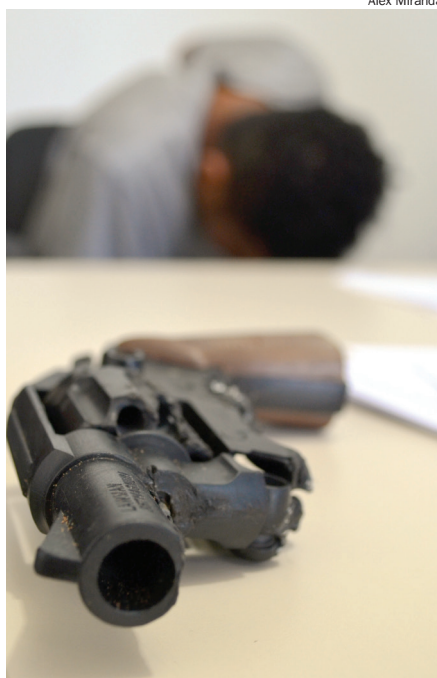
SIMULACRO de um revólver foi apresentado pelo adolescente após sua apreensão na tarde de ontem

entregou uma arma de brinquedo parecida com um revólver. Por sua vez, os PMs recolheram o simulacro e o encaminharam junto com o garoto e a bicicleta recuperada à Delegacia de Polícia.