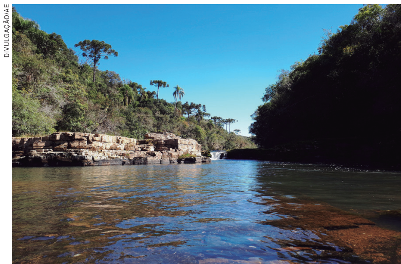
Rios do interior também oferecem muito perigo

com dados preliminares, este número dobrou. O Estado já registrou oito casos.