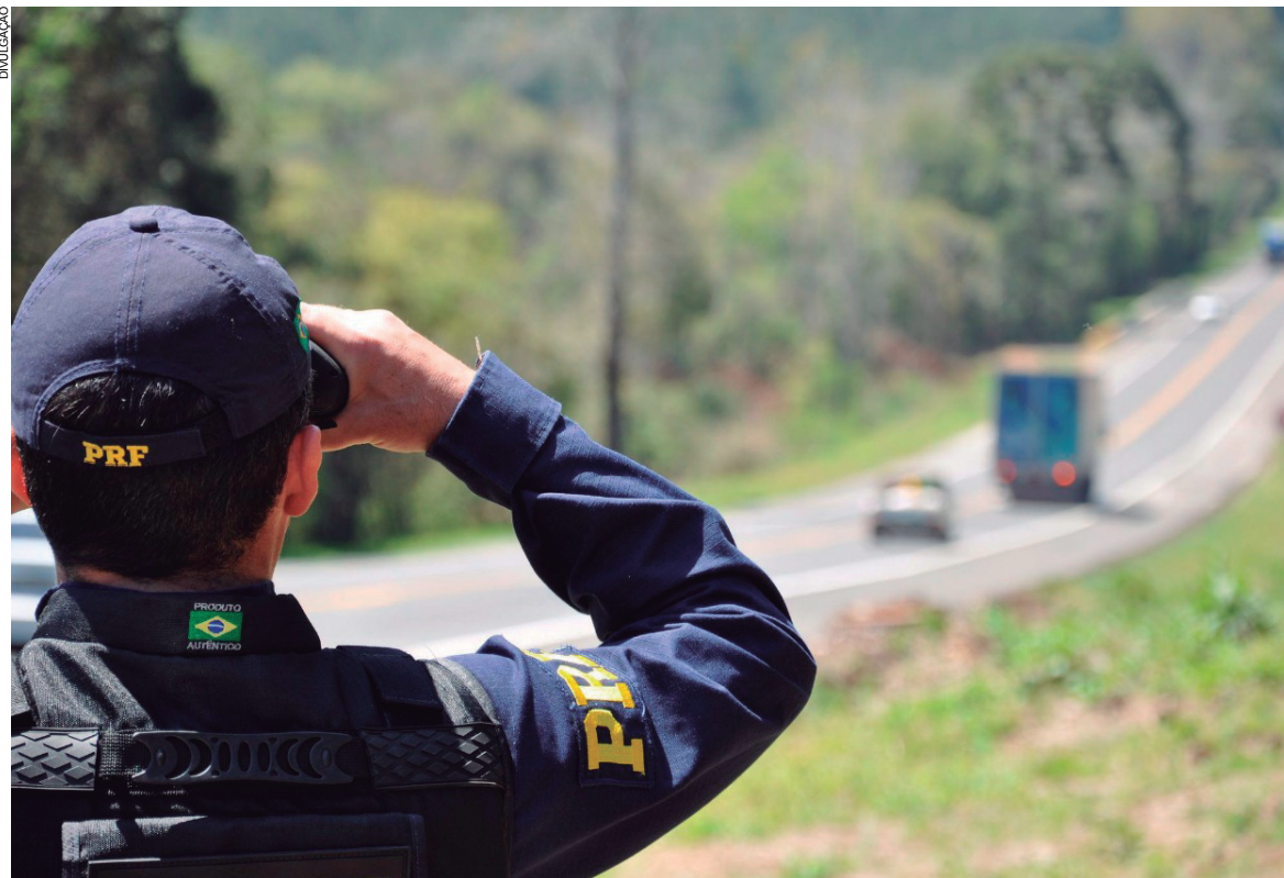
A Polícia Rodoviária Federal registrou duas mortes em 122 acidentes entre a sexta-feira 29 de Dezembro e a segunda 1 de janeiro

Como em 2016 o feriado de Ano Novo foi num domingo, a PRF não recomenda a realização de comparações simples com o ano anterior. Na ocasião, foram registrados pela PRF 93 acidentes, com 91 pessoas feridas e 14 mortes.