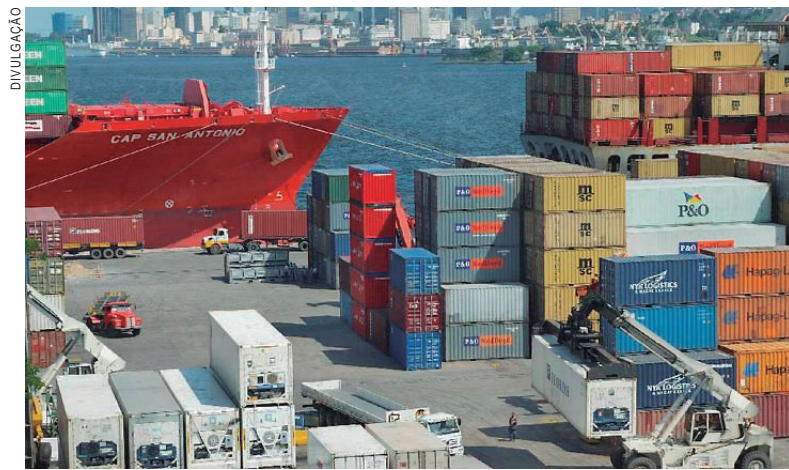
As exportações bateram recorde em 2017

As vendas de produtos básicos cresceram 28,7% no ano