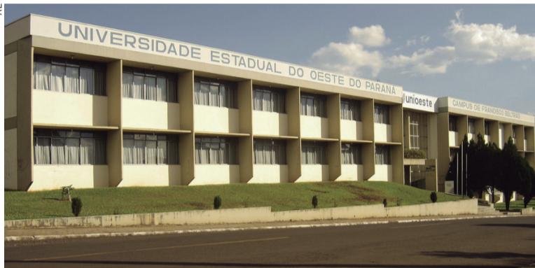
A Unioeste é uma das universidades que se destacaram

Mesmo não trabalhando com os padrões de avaliação oficiais utilizados pelo Ministério da Educação, o Guia do Estudante é uma das publicações mais conceituadas do país, edi-