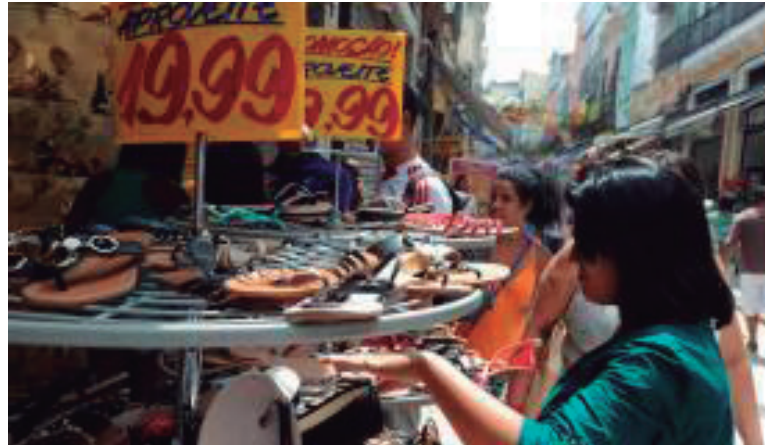
Consumidores devem conhecer seus direitos

sas regras também estão no artigo 18 do CDC.