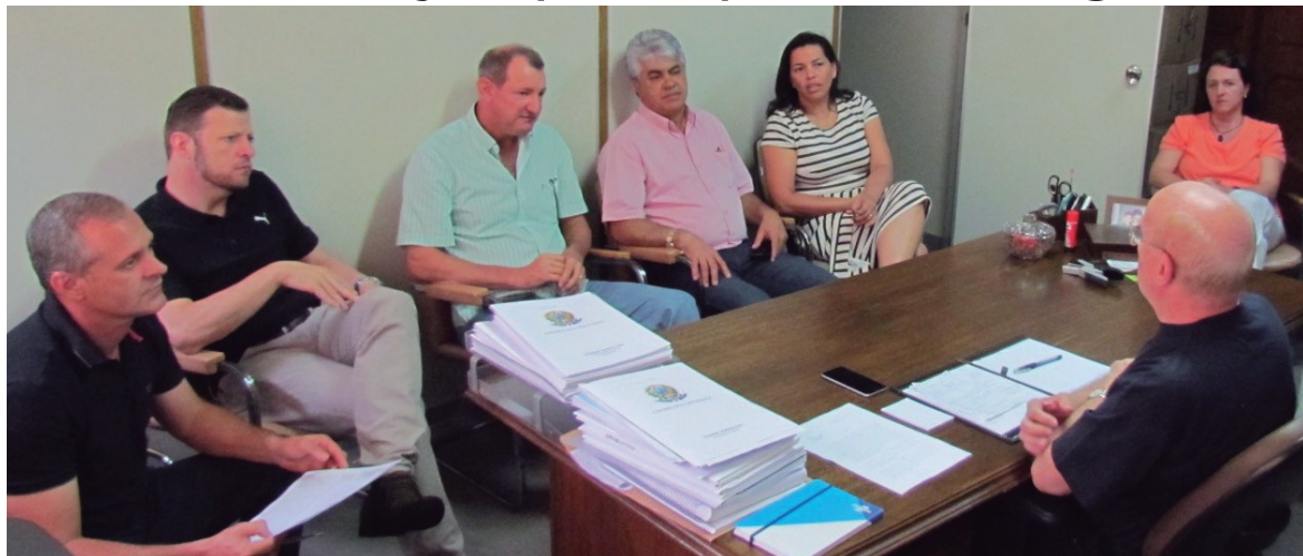
Deputado Osmar Serraglio conversa com representantes de Guaiá e Terra Roxa sobre a questão indígena

Uma comitiva formada por lideranças de Terra Roxa e Guaiá, se reuniu no último sábado (23), com o deputado federal Osmar Serraglio, Presidente da Frente Parlamentar do Cooperativismo no Congresso e Membro da Frente Parlamentar da Agropecuária, com o objetivo de discutir alternativas para solução da questão indígena que vem se acentuando nos dois municípios paranaenses.