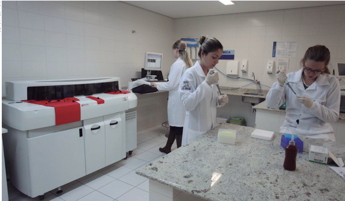
Laboratório de Universidade paranaense: qualidade indiscutível no ensino

vestimentos em educação feitos pelo Governo do Estado. "Destinamos 35% das correntes líquidas para a área, sendo que 6% vão para o ensino superior. Isso faz com que o Paraná seja o segundo do Brasil que mais destina recursos para formar estudantes e fortalecer o ensino", complementa.