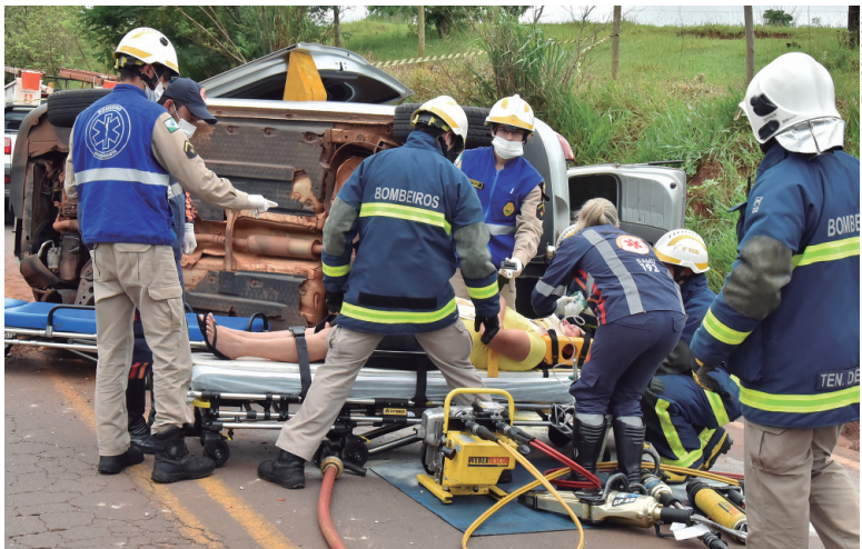
A passageira do veículo foi retirada das ferragens pelo corpo de bombeiros com a ajuda de socorristas do Samu

Um pastor evangélico perdeu o controle da direção de seu veículo na tarde de ontem (26), e capotou com toda sua família dentro do carro. Apenas a esposa ficou presa às ferragens e teve que ser retirada pelo Corpo de Bombeiros. Todos sofreram ferimentos leves e médios.