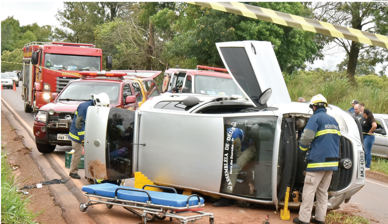
A foto é do acidente ocorrido ontem na rodovia PR 580 entre Umuarama e Serra dos Dourados

Levantamento preliminar da Polícia Rodoviária Estadual, registra mais seis mortes em rodovias estaduais.