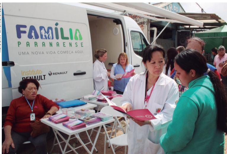
Assistência social investiu 35% mais que no ano passado

saiu na frente ao lançar o Plano Decenal de Assistência Social. O documento dá subsídios de longo prazo para o planejamento dessa política", afirma a secretária da Família.