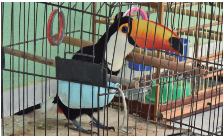
Um tucano adulto foi encontrado preso numa gaiola na propriedade averiguada pelos policiais