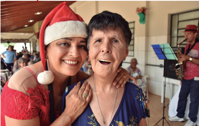
Alegria e alegria

O Lar São Vicente de Paula fez uma campanha e arrecadou na comunidade de Umuarama, presentes para alegrar o Natal dos idosos que lá residem. A festa para a entrega dos mimos aconteceu na quarta-feira, com música, vários voluntários e o Papai Noel que lá estiveram levando alegria aos corações.