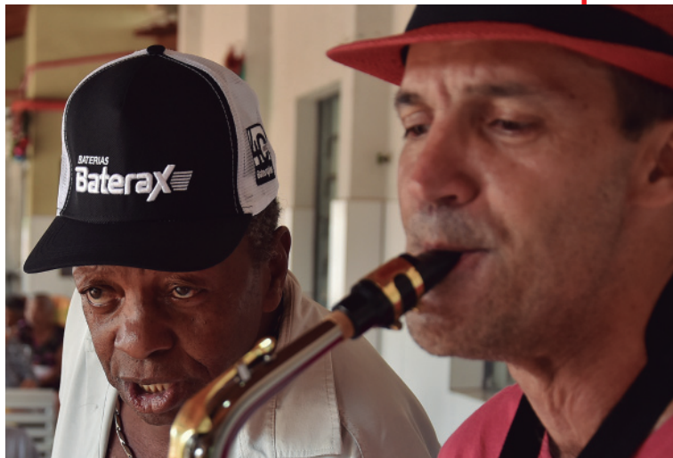
Música e recordações