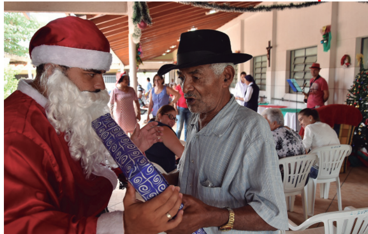
O encanto do Papai Noel