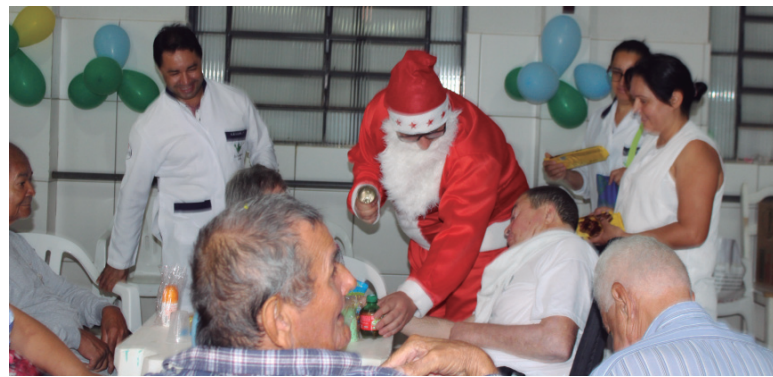
Papai Noel participou distribuindo mimos e carinho

Estudantes do curso de Enfermagem da Universidade Paranaense – Unipar, Unidade de Umuarama, promoveram mais um dia de alegria aos idosos do Lar São Vicente de Paulo (em 21/11). Com bingo, brindes, doces e a presença do Papai Noel, o evento marcou o encerramento do projeto Pró-Idoso, desenvolvido durante o ano, às terças-feiras.