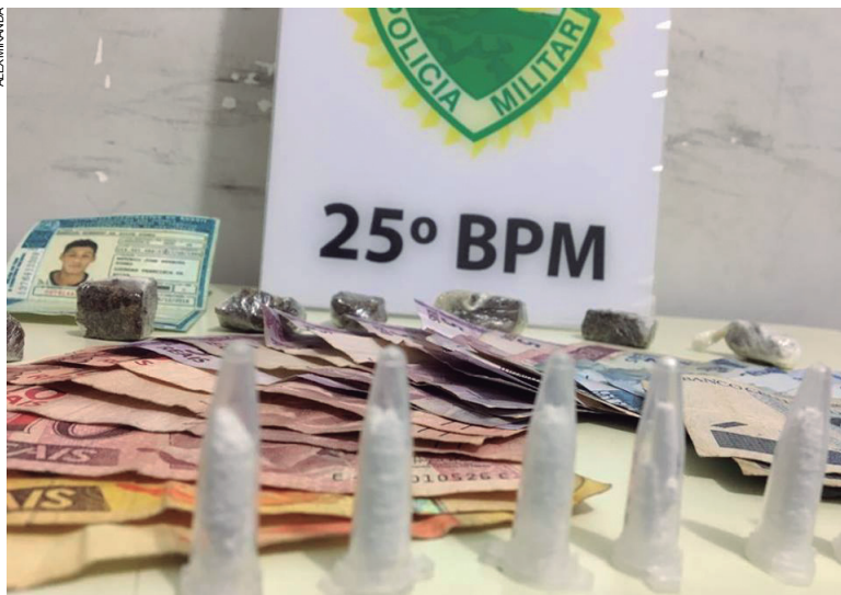
Na 'Boca do Morto' foram encontradas porções de maconha e pinos com cocaína

morador tentou se desfazer de uma sacola com a droga, jogando a mesma num vaso sanitário.