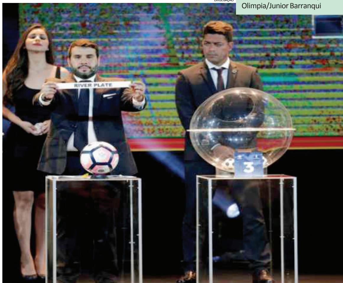
Fase de grupos tem início previsto para o dia 27 de fevereiro