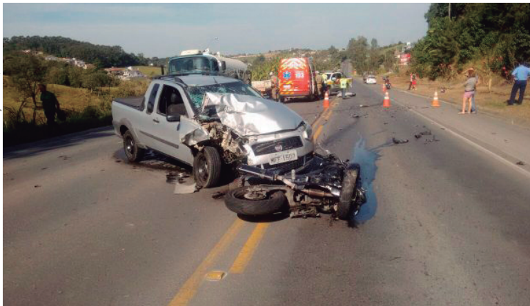
Redução de acidentes, reduz mortos, feridos e sofrimento...

anos, possam ajudar a reduzir pela metade o índice de mortes por grupos de habitantes e o índice de mortos no trânsito pelo núme-