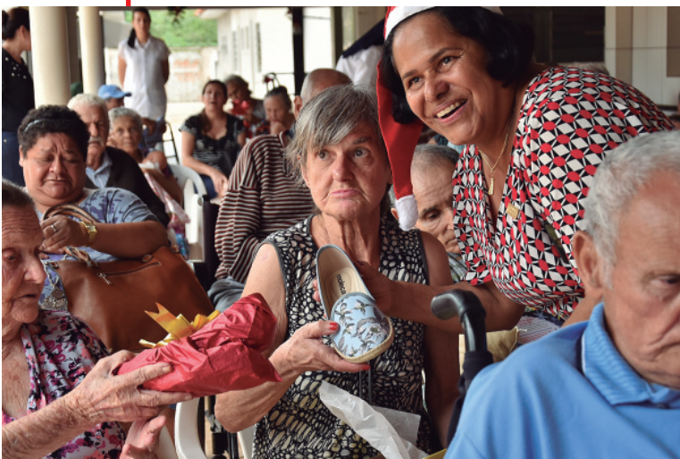
Mimos e companhia