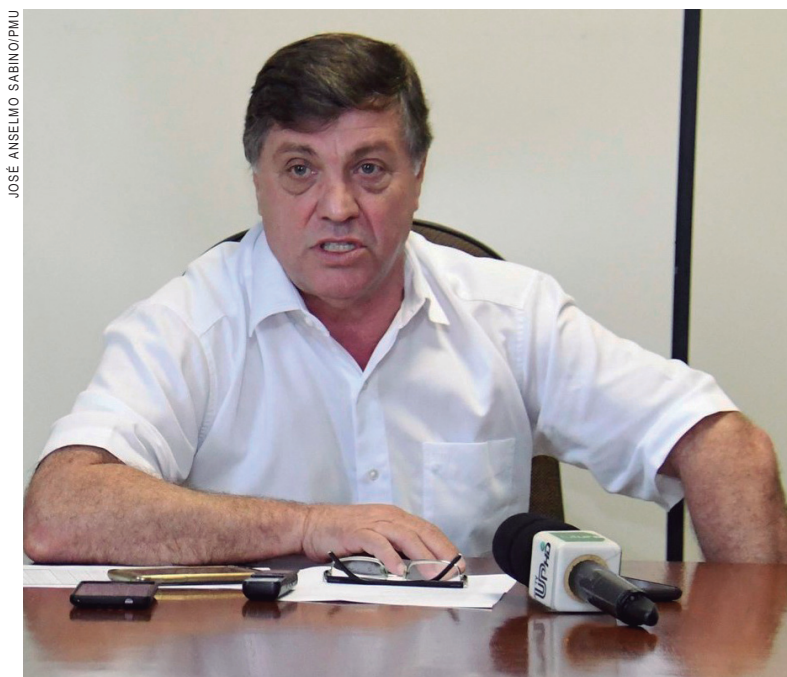
Prefeito Celso Pozzobom

Com um orçamento de 390 milhões, para 2018 agora definido de acordo com a linha de pensamento da administração (o orçamento de 2017 foi aprovado na administração an-