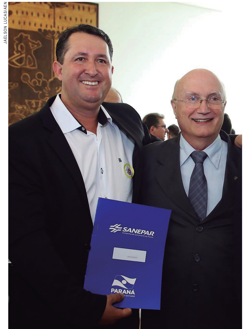
O vice-prefeito Hermes Pimentel e o deputado Osmar Serraglio, na assinatura do contrato em Curitiba