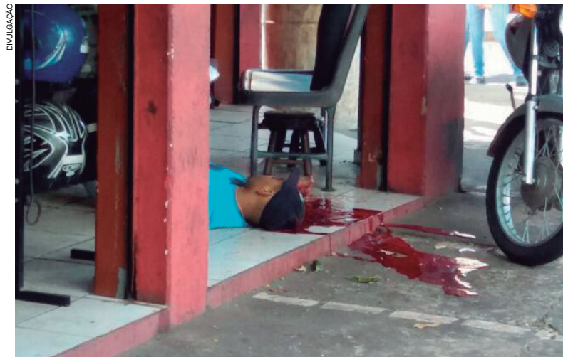
Ex-presidiário tombou morto na porta da oficina depois que foi alvejado com vários tiros de pistola

segue com a investigação. O inquérito instaurado para apurar o assassinato tem 30 dias para ser concluído.