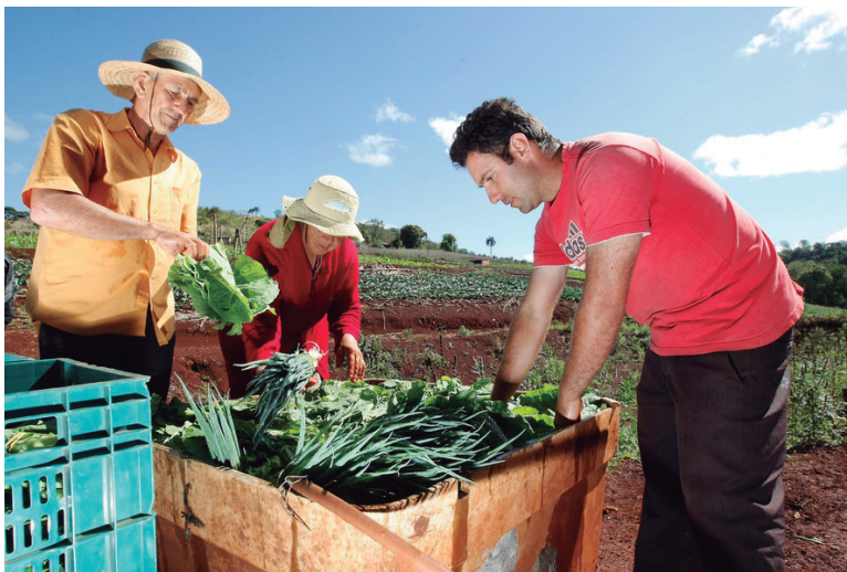
Projetos valorizam a agricultura familiar e melhoram a renda