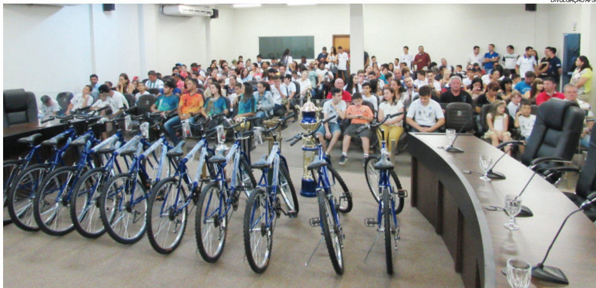
Familiares prestigiaram a solenidade de premiação

O projeto social da AFSU já existe há 14 anos e este é o terceiro ano que a diretoria da Associação Futsal premia os destaques.