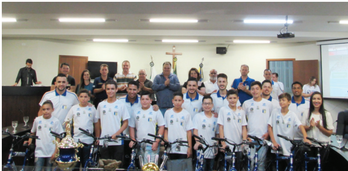
Diretoria da AFSU na entrega da premiação aos alunos destaque