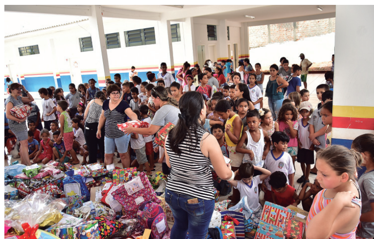
Professores e funcionários da escola ajudam a distribuir os presentes, para alegria das crianças