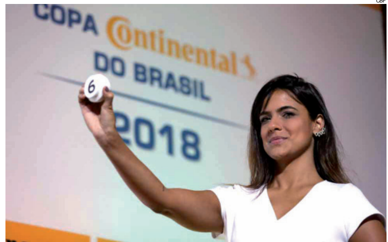
Confrontos foram sorteados ontem no auditório da CBF

do Brasil conta com duas novidades em relação ao de 2017. Com o formato mantido, o torneio não contará com o gol qualificado em nenhuma das fases. Ou seja, os gols marcados na casa do adversário não valem mais como critério de desempate. Outra mudança que atende ao pedido dos clubes é a data limite para inscrição de jogadores, que foi ampliada do dia 24 de abril (2017) para 30 de julho (2018), antes das Quartas de Final.