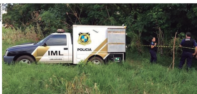
Camburão do IML na mata enquanto bombeiros e GMs de Altônia recolhiam o corpo do meio do matagal

dos Santos, teria alugado um quarto nos fundos de uma residência a cerca de 200 metros do local em que foi encontrado morto. Daquela casa ele saiu no dia 7 de dezembro, levando o colchão e todos seus pertences. Desde então não foi mais visto. O corpo estava em avançado estado de decomposição e somente no IML é que foi constatado que apresentava lesões na cabeça. A Polícia Civil de Altônia deu início às investigações.