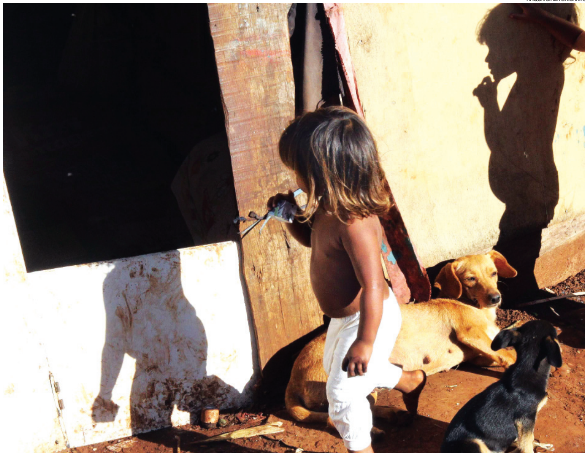
Estudos confirmam a gravidade da desigualdade social brasileira

Não existe uma classificação oficial no Brasil do que se considera pobreza extrema. O IBGE mensurou o percentual da população nessas condições conforme diversas definições, além da do Banco Mundial.