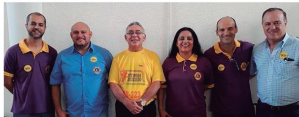
Companheiros e domadoras do Lions Clube de Umuarama prestigiando o evento ocorrido no Teatro da Unipar.

No dia 08/12/2017 aconteceu, no Teatro da Unipar, campus sede, um encontro com o objetivo de fortalecer as ações que apoiam a duplicação da PR 323, rodovia campeã em número de acidentes e vítimas fatais no Estado do Paraná. Ao final do encontro foi apresentada a Carta do Noroeste, em que as lideranças se comprometem a sair do campo apoio e desenvolver ações efetivas pela duplicação da PR-323.