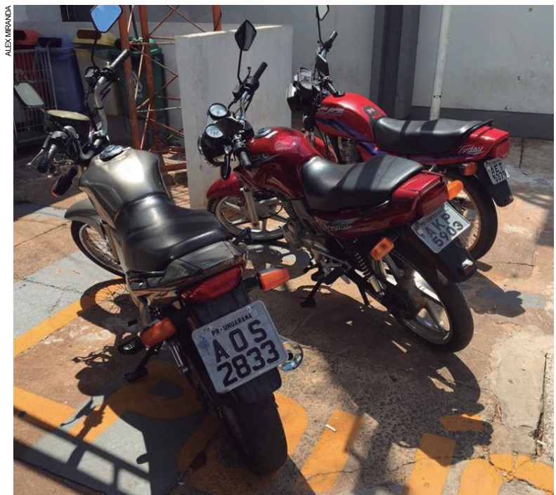
As motocicletas furtadas e roubadas foram recuperadas na ação realizada em conjunto entre Polícias Civil e Militar