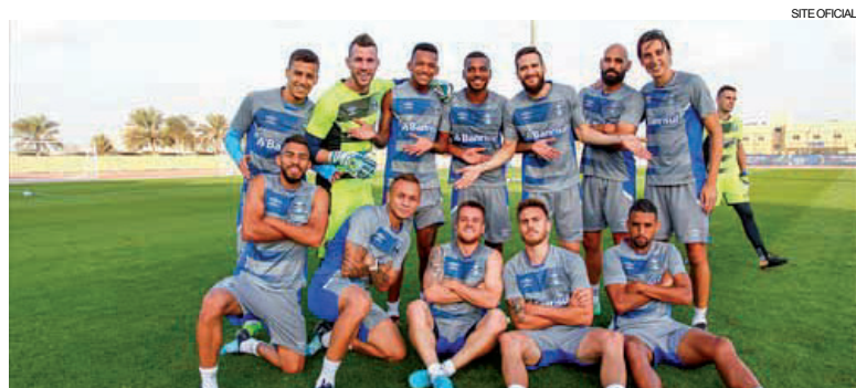
Tricolor joga contra o Real Madrid, no Zayed Sports City, em Abu Dhabi