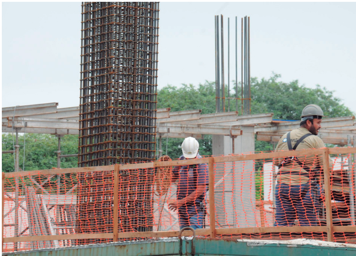
JOSÉ ANSELMO SABINO/PMU

O setor é o que mais absorve mão-de-obra