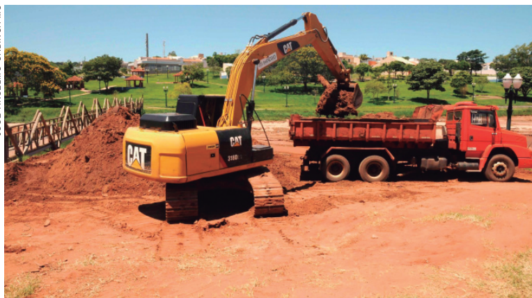
Maquinários trabalham na remoção da areia do Lago Aratimbó