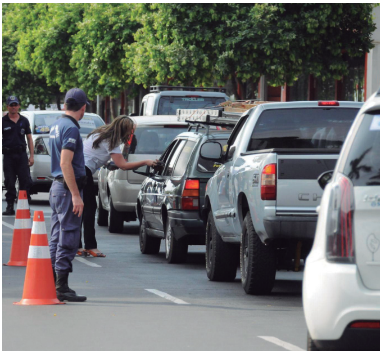
Pague em dia para evitar parada em blitz

em três parcelas, sem acréscimos, nos meses de janeiro, fevereiro e março, também observando os vencimentos de acordo com o último número da placa.