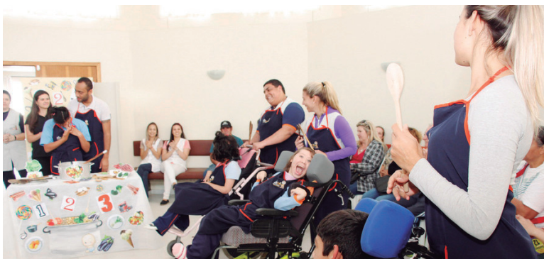
Recursos servirão para compras de equipamentos