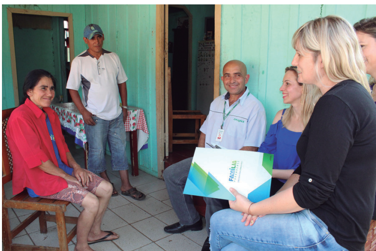
Visitas constantes e orientação às famílias, fazem parte do trabalho