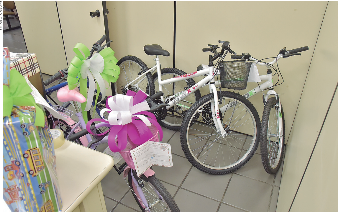
Papai Noel dos Correios vai entregar até bicicletas