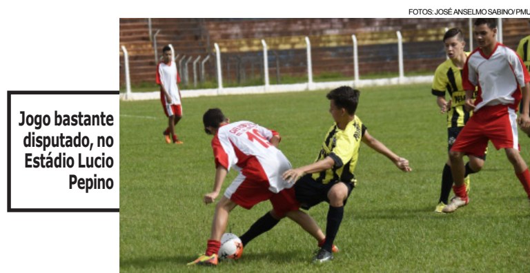
Jogo bastante disputado, no Estádio Lúcio Pipino

Na disputa pelo 3º lugar a equipe ACI/Aceru não conseguiu