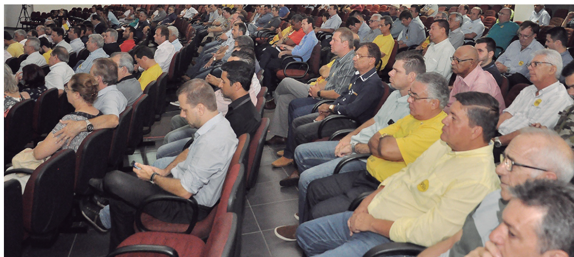
Personagens que lutam pela duplicação

sendo debatido com mais ênfase desde o ano de 2010, quando a Aciu passou a encabeçar movimento pela duplicação. Naquela época também se mobilizou a sociedade, ainda que não tenha chegado ao ponto de organizar uma Comissão independente e apartidária. O resultado está aí ! A sociedade continua batalhando, e agora recomeçando e, ao que tudo indica, mais forte, mais organizada. Alguns comemoram avanços, embora tudo que aconteceu até agora não tenha saído do papel. No entanto, uma coisa está ficando clara a partir de todo esse trabalho que a Comissão pela Duplicação vem realizando: os cidadãos da região estão cheios de promessas ! A sociedade quer, por-