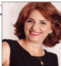
Por Ângela Russi

O Mr. Chopp de Umuarama, que está localizado na Av. Apucarana, 4048 promove hoje o show da banda umuaramense Os Diplomatas. A banda se apresentará na versão acústica, misturando os gêneros MPB, Poprock, Rock nacional e também Rock interativo.