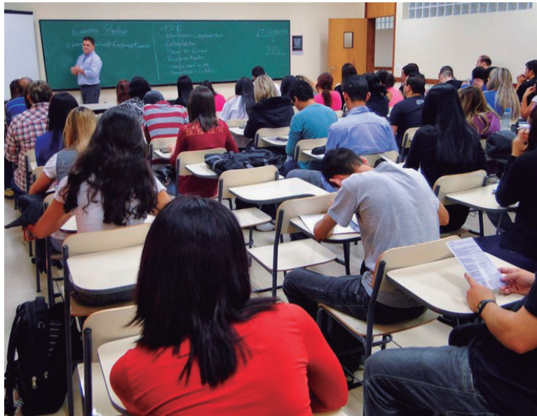
A nova lei estabelece juro zero para beneficiários nos contratos assinados a partir de 2018

Os Ministérios do Planejamento, Desenvolvimento e Gestão e da Educação recomendaram vetos a dois trechos da lei, que foram acata-