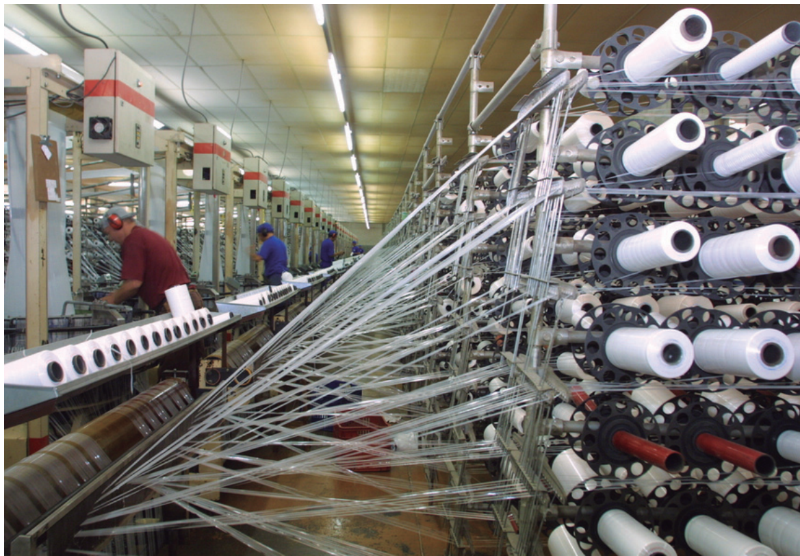
Indústrias respiram um pouco mais, com a prorrogação de benefícios

O Governo do Paraná prorrogou, para 30 de abril de 2019, o prazo de vigência de vários benefícios fiscais para empresas do Estado. Entre os benefícios, está a redução da base de cálculo, nas saídas internas feitas por fabricantes de painéis de madeira (MDP e MDF), exceto para consumidor final, de forma que a carga tributária resulte em 7%.