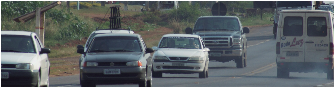
Com menor valor, carro usado pagará menos IPVA

nos de VW/GOL 1.0 fabricados de 2008 a 2012 terão imposto 14,97% menor, enquanto os proprietários de Fiat/Uno Mille Fire Flex, com anos de fabricação de 2005 a 2007, vão pagar 7,53% menos.