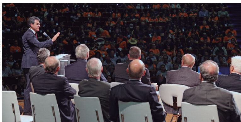
Governador Beto Richa Participa da abertura do Encontro Estadual de Cooperativistas Paranaenses 2017, e recebe homenagem pela sua contribuição e trabalho em prol do desenvolvimento do cooperativismo paranaense, durante evento realizado pela Organização das Cooperativas do Paraná (Ocepar).

"As cooperativas paranaenses contam com o apoio do nosso governo, para que se consolidem cada vez mais como uma referência no Brasil", afirmou o governador. Além do Paraná Competitivo, ele citou as linhas de crédito ofertadas pelo Banco Regional de Desenvolvimento do Extremo Sul (BRDE) e pela Fomento Paraná.