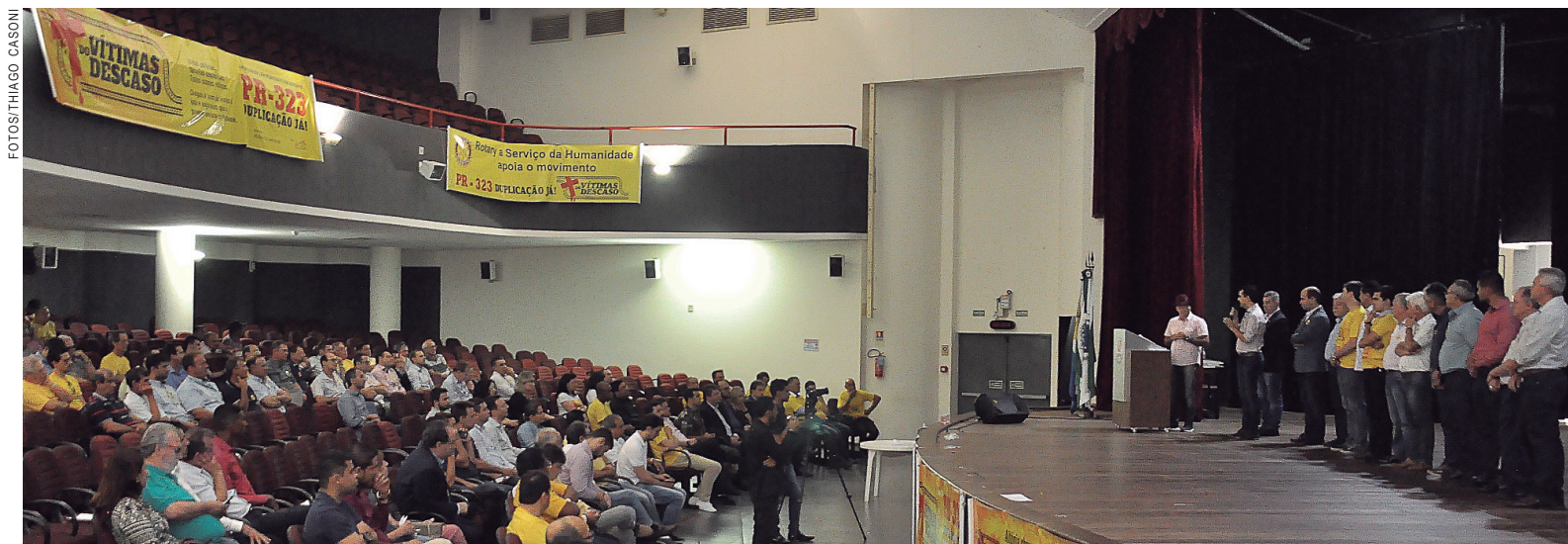
Personagens que gritam pela vida

riscarem em ultrapassagens forçadas. E o resultado, em alguns casos, é o acidente, com vítimas fatais ou com feridos que deixam sequelas pelo resto da vida.