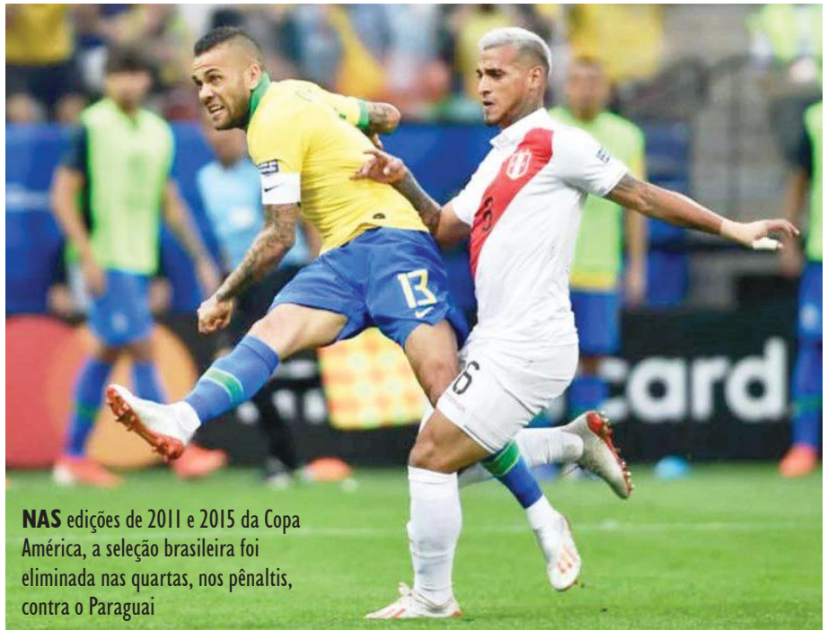
NAS edições de 2011 e 2015 da Copa América, a seleção brasileira foi eliminada nas quartas, nos pênaltis, contra o Paraguai

Nas últimas três edições da Copa América, o Paraguai venceu apenas uma partida, mesmo assim foi finalista em 2011. É uma equipe que empata muitas vezes e, dessa forma, vai conquistando vagas. Foi o que aconteceu neste ano. A equipe classificou-se com dois empates e uma derrota. Contra a Argentina e Brasil, times mais fortes da América do Sul, foram cinco empates (dois com argentinos