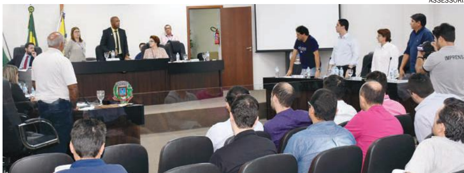
VEREADORES discutiram projetos enviados pela prefeitura. Entre eles, está a autorização de crédito no valor de R$ 25 milhões

Ainda tratando da estrutura administrativa da Prefeitura Municipal de Umuarama, o Projeto de Lei Complementar 011/2019, que dá nova redação a estrutura de secretarias,