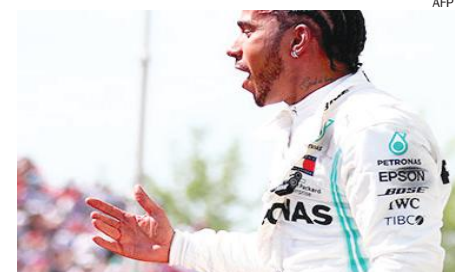
HAMILTON entrou na F1 em 2007, com a McLaren, em seu primeiro ano subiu quatro vezes no alto do pódio

O inglês acumula 79 vitórias em sua carreira, conseguidas em 237 corridas – uma média de uma vitória a cada três corridas – contra 91