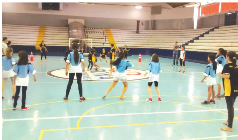
Ginásio de Esportes vai ser palco de várias competições

12/12 • Bola queimada feminino 14/12 • Finais • Cabo de guerra • Corrida de estafeta • Futsal masculino • Basquete pré-desportivo feminino • Bola queimada masculino • Bola queimada feminino • Premiação das modalidades • Premiação/ classificação geral