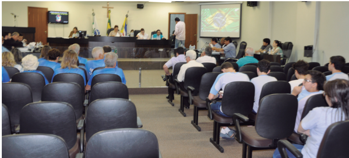
Cidadãos marcaram presença na sessão que aprovou o orçamento

E m primeira discussão e votação na Câmara Municipal, foi aprovado, com três votos contrários, o Orçamento Anual elaborado pelo Poder Executivo Municipal, que prevê a dotação orçamentária para o ano de 2018, no valor de R$ 389.960 milhões.