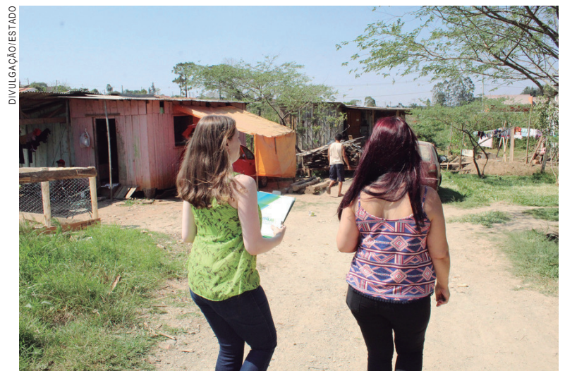
Os municípios devem fazer levantamento sócio econômico e identificar as necessidades de habitação

Para tirar dúvidas ou buscar mais orientações, a prefeitura pode procurar o escritório regional da Secretaria da Família ou da Cohapar que atendem seus municípios.