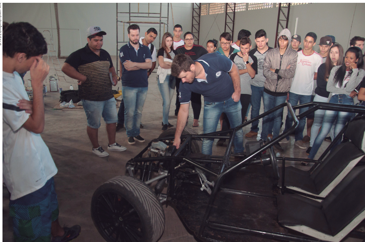
Protótipo para palestras: acadêmicos montaram o carro e explicam como funcionam os dispositivos de segurança

No vestibular de domingo (3), o curso de Engenharia Mecânica esteve entre os mais concorridos, mas é possível que sobre vagas. Se isso acontecer, o curso será incluído na lista do Módulo II (processo seletivo das vagas remanescentes).