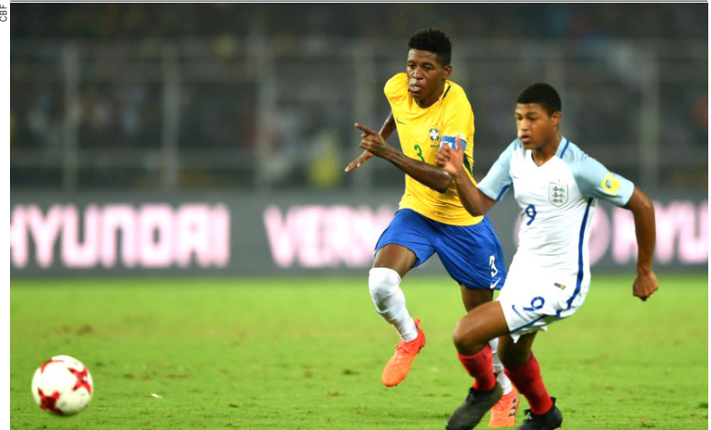
A Copa do Mundo de Futebol Sub-17 definirá hoje se o troféu de campeão da edição 2017 irá para a Espanha ou para a Inglaterra. As seleções dos dois países medem forças às 12h30 (de Brasília) deste sábado na cidade de Calcutá, na Índia, pela decisão. Antes, no mesmo estádio, Brasil e Mali disputarão o terceiro lugar, a partir das 9h30 do horário brasileiro.