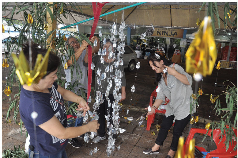
A festa ganhou decoração típica japonesa

Após oito anos desde a última Nippon Fest, a Associação Cultural e Esportiva de Umuarama (Aceu) está resgatando uma das festas mais tradicionais da cultura japonesa na cidade. A 5ª NipponFest iniciou ontem (27),