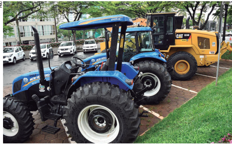
Foram comprados 20 veículos, entre carros, caminhões e maquinários

Foram comprados ainda uma escavadeira hidráulica Case, dois tratores agrícolas New Holland, uma pá carregadeira Caterpillar e uma mononiveladora Caterpillar para a Secretaria de Serviços Rodoviários, e quatro veículos Fiat Mobi para a Secretaria Municipal de Saúde. "Esse é o resultado do