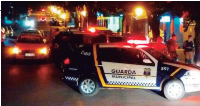
Operação vistoriou tabacarias e bares situados na região central de Umuarama e alguns foram interditados

gislativas, os integrantes da Aifu vistoriaram os estabelecimentos que comercializam o fumo e que notadamente são cada vez mais frequentados por jovens.