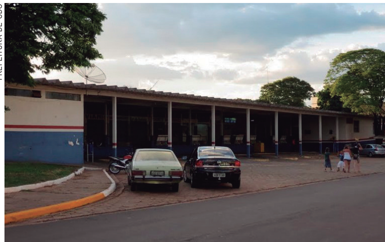
As câmeras trará mais segurança aos frequentadores