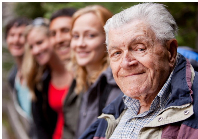
Em Santa Catarina, Espírito Santo, Distrito Federal, São Paulo, Rio Grande do Sul, Paraná e Minas Gerais, a expectativa de vida das mulheres ultrapassou os 80 anos

Desde 1940 a expectativa de vida do brasileiro aumentou em 30 anos.