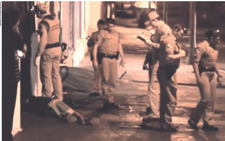
Jovem de 22 anos com passagens por uso de drogas e pichação, foi executado a tiros na madrugada no centro

num carro escuro que não foi identificado pelas testemunhas.