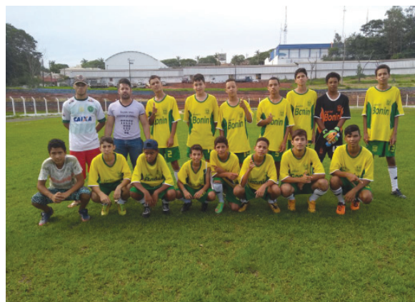
Serra dos Dourados