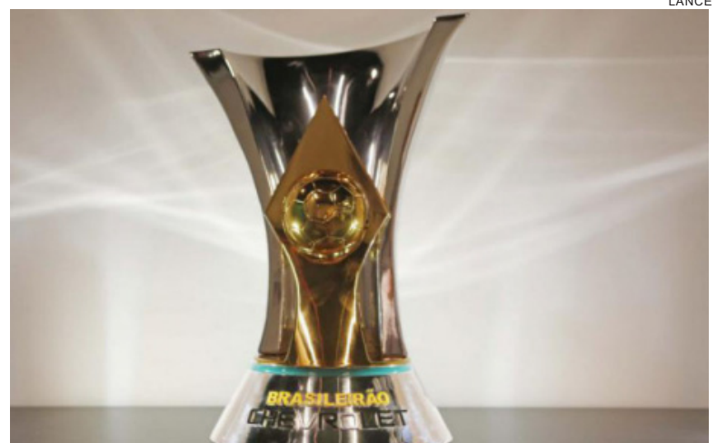
Corinthians, já sagrado hexacampeão

Z4 e além de uma vitória tem de torcer por tropeços de Coritiba ou Vitória.