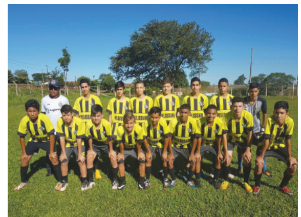
Alto São Francisco