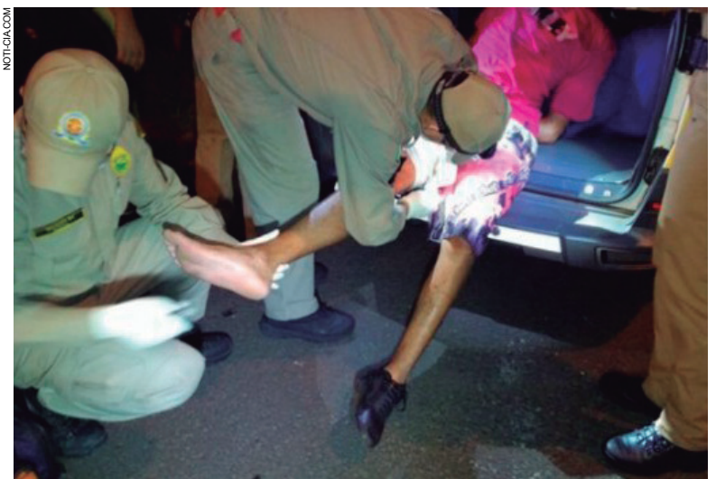
Jovem foi ferido numa das pernas depois de se confrontar com policiais militares de Cianorte durante fuga de moto

A guarnição revidou e um dos jovens foi atingido na perna direita. Sob escolta, o rapaz foi