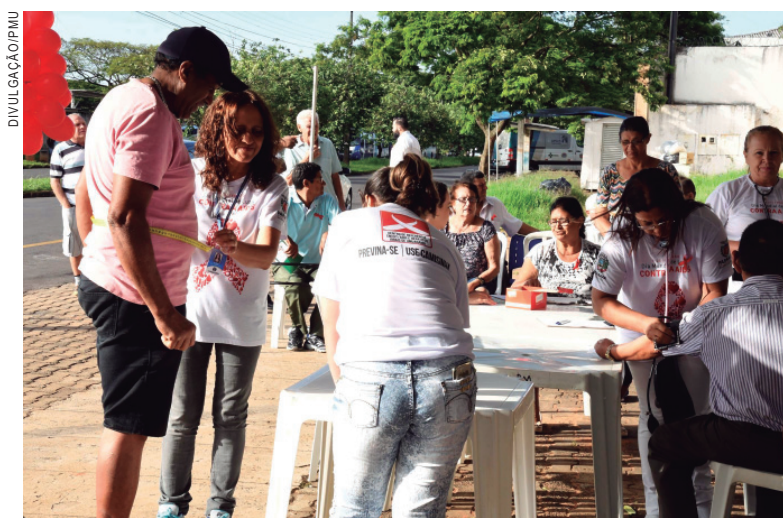
Em Umuarama, o dia de luta contra a Aids, teve campanha de prevenção

Boletim demonstra que, nos últimos dez anos, há uma tendência de queda de casos em mulheres e aumento em homens. Em 2016, foram 22 casos de aids em homens para cada 10 casos em mulheres. Em relação à faixa etária, a taxa de detecção quase triplicou entre os homens de 15 a 19 anos, passando de 2,4 casos por 100 mil habitantes em 2006 para 6,7 casos em 2016.