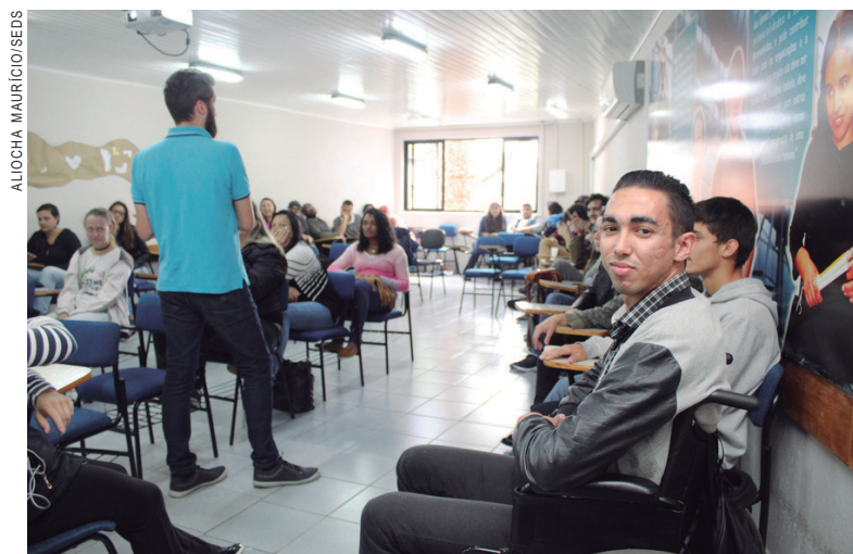
Vagas para adolescentes aprendizes aumentam 65% depois de campanha

do do trabalho por meio de programas de aprendizagem. Neste ano, o número saltou para 1.048", diz o coordenador.