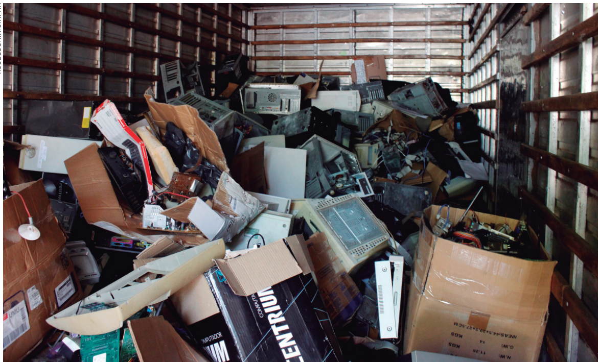
Material arrecadado no projeto foi repassado à Cooperuma para destinação correta

nológico vem avançando vertiginosamente e, com a intenção de possuir um aparelho mais moderno, o dono o troca, em