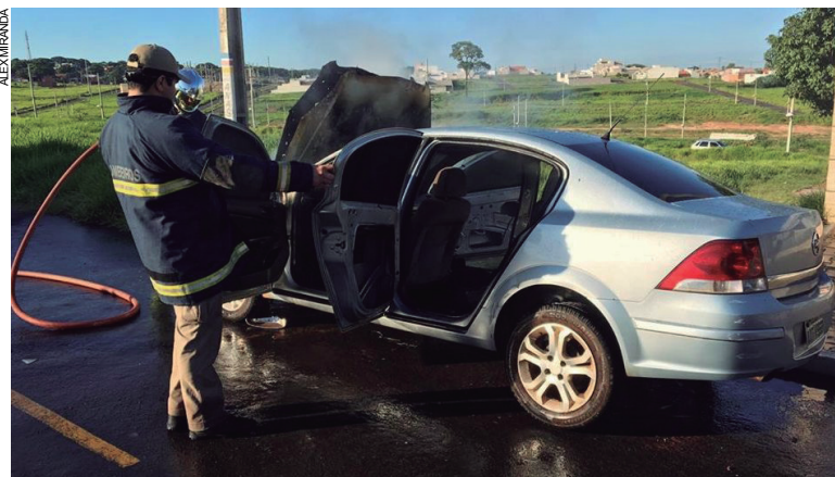
Veículo pegou fogo no Conjunto Guarani e bombeiros descobrem que estava preparado para o transporte de mercadorias ilícitas

licitou a presença de um caminhão guincho para recolher o Vectra dali.