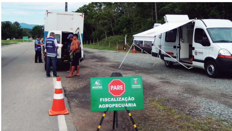
A Agência de Defesa Agropecuária do Paraná (Adapar) está intensificando a fiscalização do trânsito de animais, vegetais, insumos e produtos de origem animal na região Litoral do Estado

O acesso ao produtor será liberado se todas as informações das explorações pecuárias forem confirmadas, como número de animais na propriedade, raças, espécies e, também, se todos os requisitos sanitários estiverem em dia, como as vacinações obrigatórias. Caso a Adapar constate divergência ou uma não conformidade poderá cancelar o acesso ao produtor.